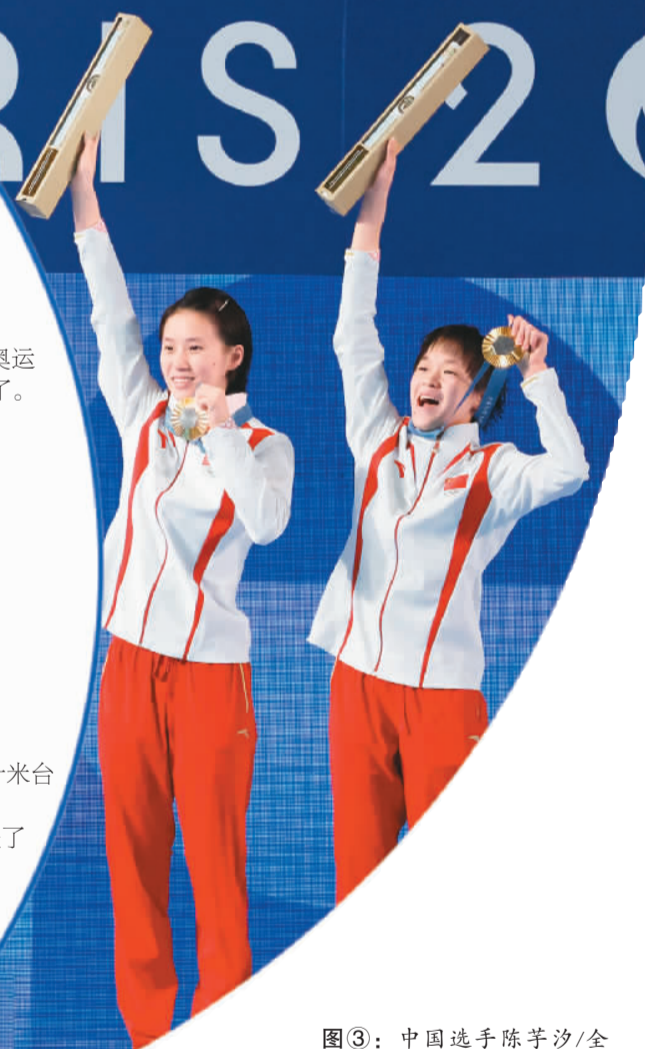
图③：中国选手陈芋汐/全红婵（右）在跳水女子双人十米台决赛中夺得金牌。

陈芋汐和全红婵彼此陪伴、一起成长，是对手也是搭档，更是彼此运动生涯中不可或缺的朋友。接下来，她们还将在单人项目中展开较量。