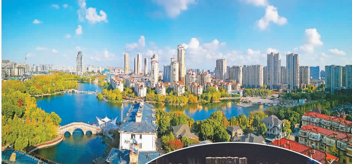
▲繁荣富庶的如东。 ▶车水马龙的如东夜景。

唐文宗开成三年，亦即公元838年，日本派出第18次遣唐使团，这是成行的最后一次。随遣唐使到中国来的日本天台宗圆仁和尚，著有《入唐求法巡礼行记》（以下简称《入唐记》）。该书最早的手抄本在日本明治年间被发现时，曾使“日本朝野为之一振”，并