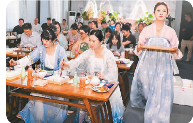
“嵯情家味·羲之雅宴”上，游客们身穿汉服边欣赏古风表演，边品尝桃形李主题特色菜肴。

据介绍，本次活动秉持“文化搭台，经济唱戏”理念，依托华堂古村的历史风貌，借“羲之雅宴”入笔，翰墨书香碰撞桃李美味。活动时间贯穿整个桃李采摘季，预计带动消费3亿元，进一步打响“嵯情家味”品牌，探索农文旅深度融合、赋能乡村全面振兴的新模式。