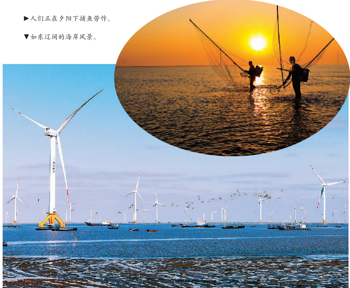
▶人们正在夕阳下捕鱼劳作。