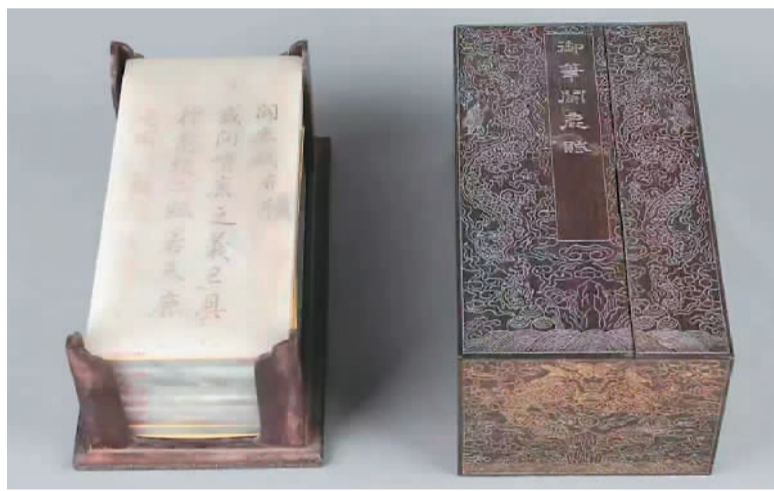
▲清乾隆御制《斗鹿赋》玉册。