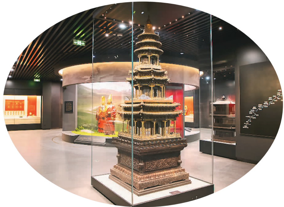
▲清代紫檀木座珞琅万寿塔。 ▼清代冷枚绘避暑山庄图。