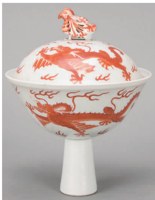
▲清乾隆白地红龙天鸡钮高足盖碗。

“为加强文物资源保护、挖掘与利用，更好地促进文博事业繁荣发展，2022年9月，承德博物馆与承德避暑山庄博物院、档案馆、信息中心等单位合并，成立承德避暑山庄博物院。”承德避暑山庄博物院院长孙继新告诉记者，博物院以“汲古润今 博物承德”为宗旨，着力推进文化遗产保护传