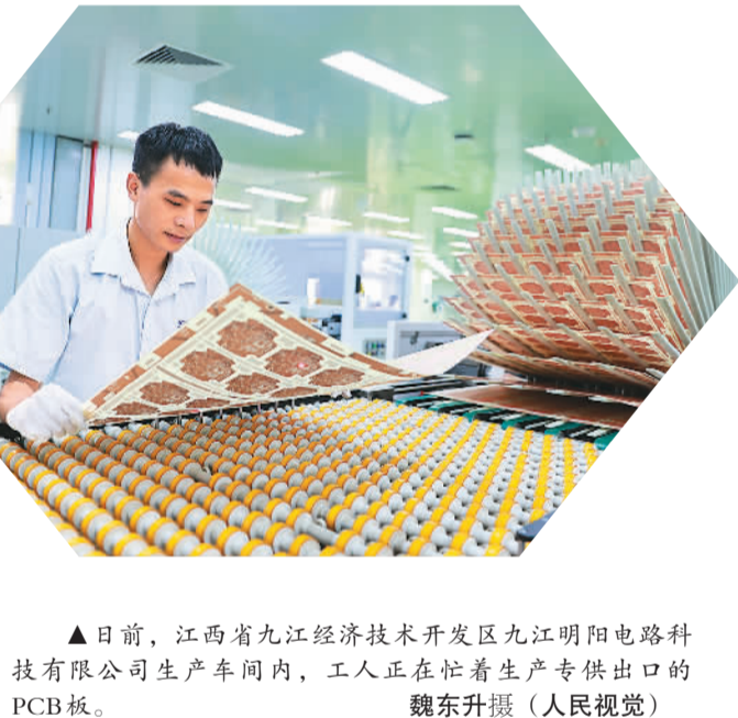
▲日前，江西省九江经济技术开发区九江明阳电路科技有限公司生产车间内，工人正在忙着生产专供出口的PCB板。