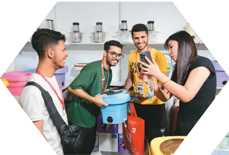
▲7月24日，浙江省金华市义乌国际博览中心，中外客商在2024中国义乌日用百货科技创新博览会上洽谈。