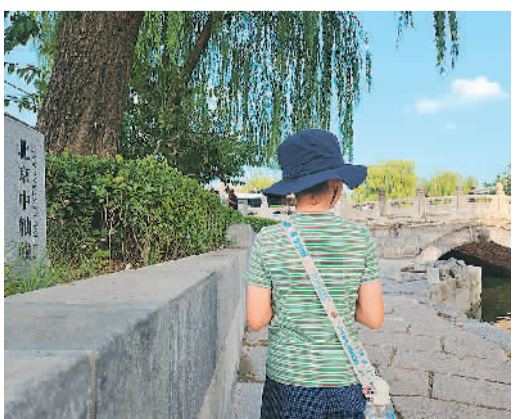
“北京中轴线”申遗成功当日，一名小朋友在万宁桥边游览。

“这永定门，还有故事在里面呢……”何林元镜头下，来自北京东城区快板沙龙的三位表演者正在钟鼓楼广场表演节目《问路》，节目借由妙趣横生的问路场景，引领观众踏上一段别开生面的北京中轴线探索之旅。