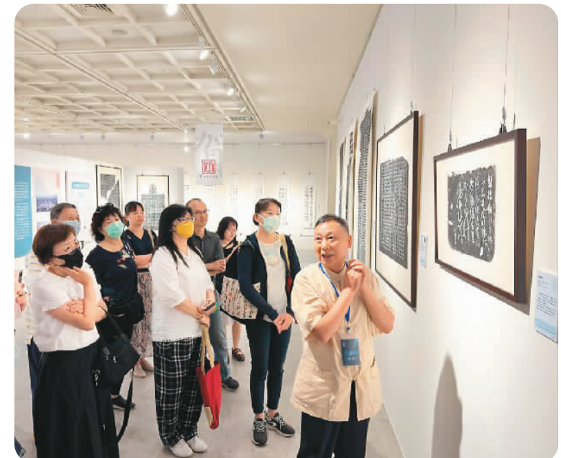
▲ 人们在南投参观“西安碑林海峡两岸临书展”。新华社记者 王承昊摄