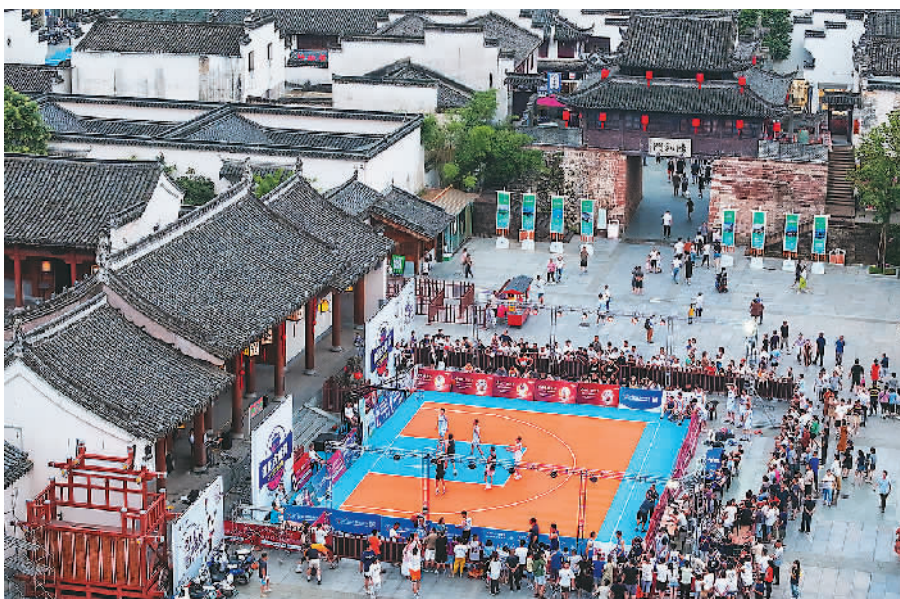
近年来，安徽歙县持续丰富体育旅游产品和服务供给，激发体育旅游消费，促进“文化+旅游+体育”高质量发展。图为参赛选手在徽州古城篮球争霸赛中竞技。

以江苏苏州为例，近年来，苏州积极带动全民健身，还承办了不少重要赛事，鼓励本地居民“走出家门”运动，也吸引外地运动爱好者来苏州参赛、观赛。据统计，在苏州举办的2023年苏迪