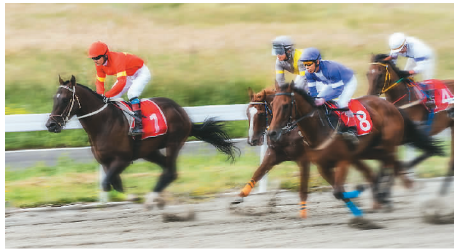
近日，第十二届全国少数民族传统体育运动会马上项目民族赛马比赛在新疆维吾尔自治区伊犁哈萨克自治州昭苏县举行，吸引不少游客前来观赛。图为骑手们在比赛中挥鞭马鞭，骏马疾驰。

“跟着赛事去旅行”2024暑期全国户外运动赛事目录中，有不少青少年赛事，包括2024年中国青少年（中学生）潜水定向大赛、2024年全国青少年皮划艇U系列联赛、全国青少年U系列竞速小轮车冠军赛、锦标赛等，预计将带动大批家庭前往赛事举办地参赛、观赛。为一场赛事赴一座城，正成为亲子游、家庭游的新内容。