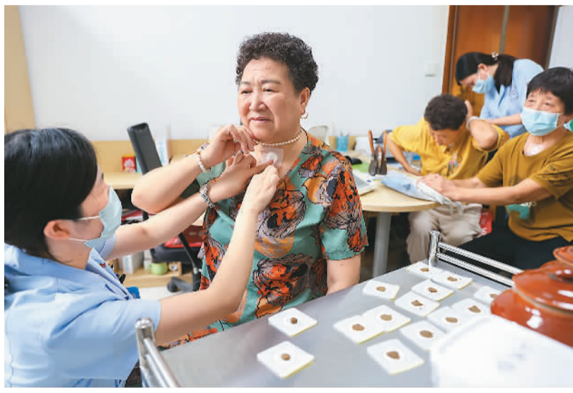
7月15日为入伏首日，浙江省湖州市德清县洛舍镇卫生院护士在给村民贴三伏贴。

“自夏至开放‘三伏贴’服务预约以来，截至目前已经有近4万人通过线上预约。我们做过统计，贴三伏贴从人群分布来说，以前更多集中在