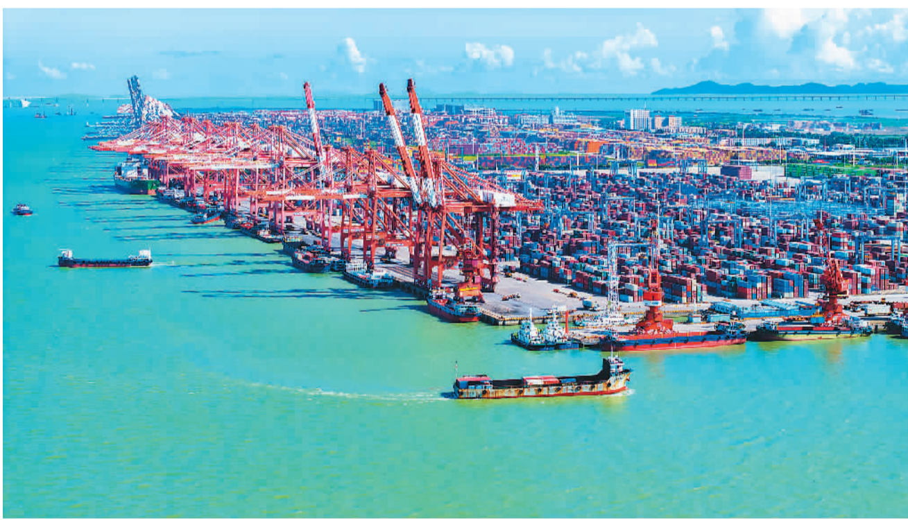
连日来，位于广东省广州市的广州港南沙港区集装箱码头一片繁忙，货轮进出港装卸货物，码头桥吊紧张有序运行。图为远眺广州港南沙港区集装箱码头。

“爱·在芒果”实习交流活动是两岸品牌交流活动之一，目前已成功举办6届，累计约300名来自台湾高校的大学生、研究生进入湖南广电开展交流实习。