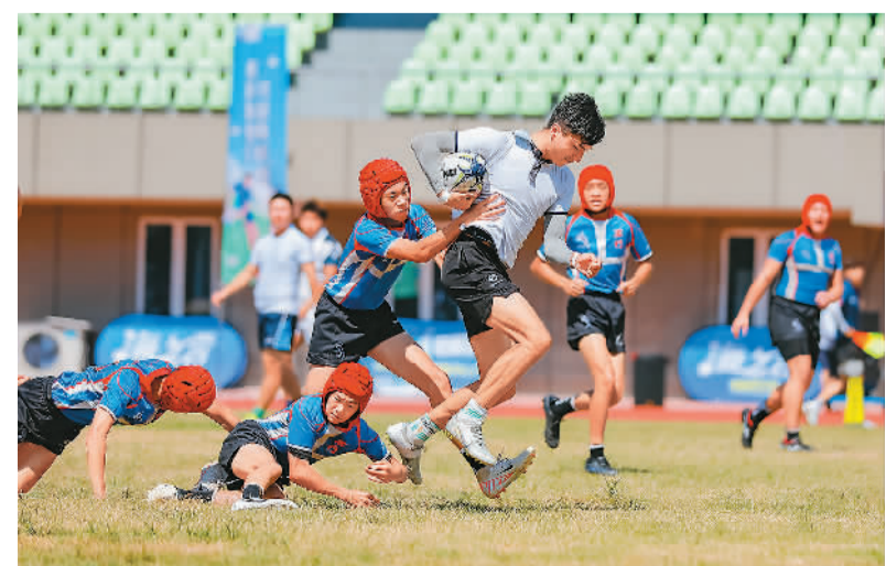
第九届海峡两岸（福建）青年英式橄榄球交流赛暨2024年全国触式橄榄球分区赛（福州站）近日在福建省福州市海峡奥林匹克体育中心举办。赛事活动吸引来自福建、台湾等地的52支队伍、近800名运动员同场竞技交流。图为两岸运动员在比赛。