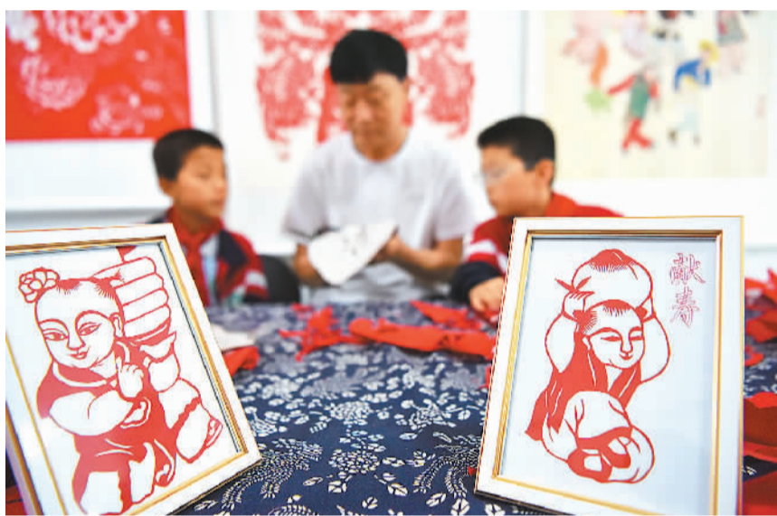
山东高密姜庄镇产学研实践基地内,非遗传承人指导小朋友剪纸。

多地积极布局研学旅行“新赛道”,大力发展研学游,打造优质产品。这一举措正成为不少地方推动文旅品质提升、全域