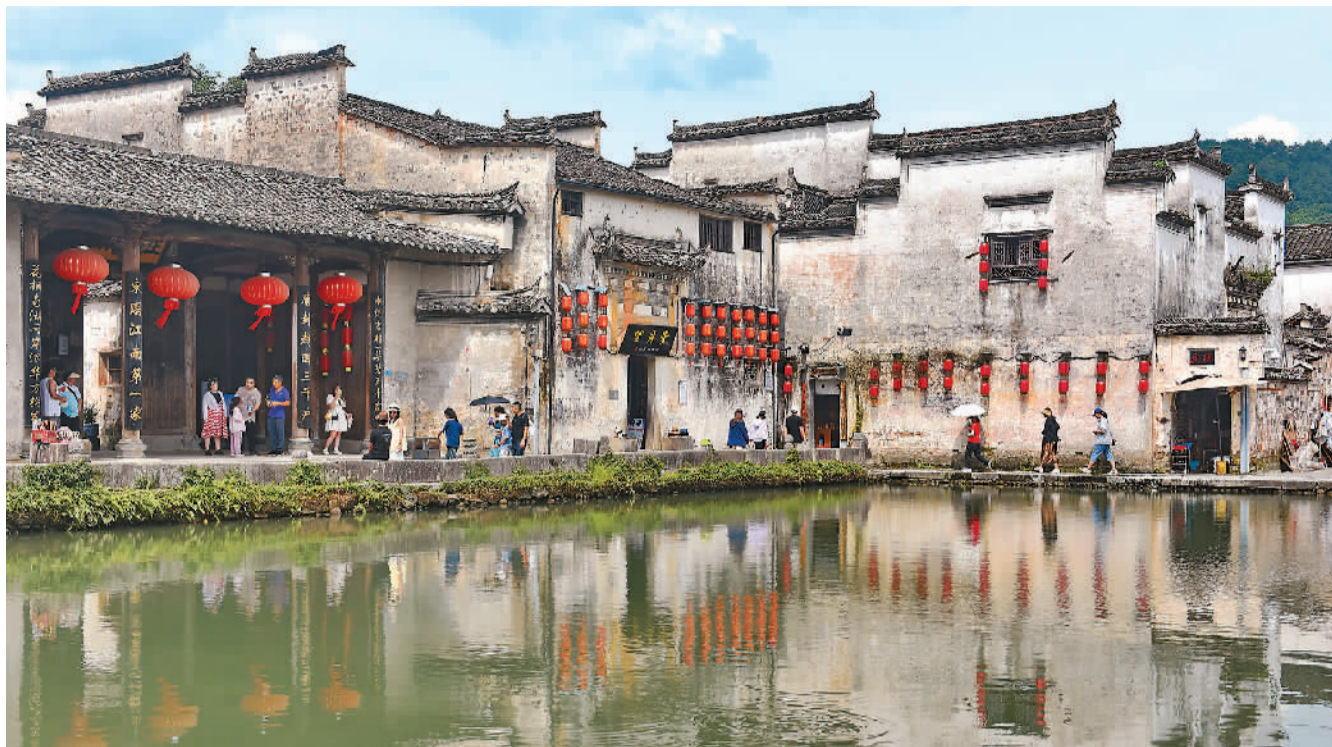
随着暑期旅游季的到来,享有“画里乡村”美誉的安徽省黄山市黟县宏村景区推出研学游、亲子游等多种旅游产品,图为游客在宏村景区游玩。

以大中小学生为主要客群的研学旅行,人气更是居高不下。人们选择在这个火热的夏天“行万里路”,欣赏祖国壮美山河,体验悠久传统文化,感受时代发展脉搏。不少地方也通过升级、优化研学旅行产品,开辟推动当地旅游业高质量发展、打造地方文旅品牌的重要途径。