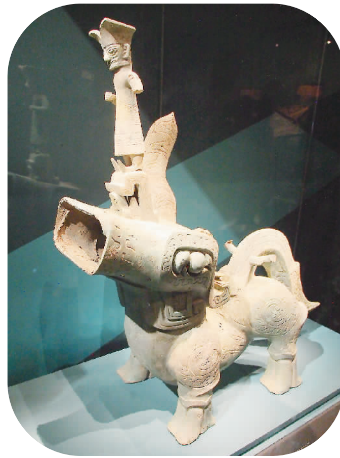
三星堆遗址八号坑出土的铜神兽。