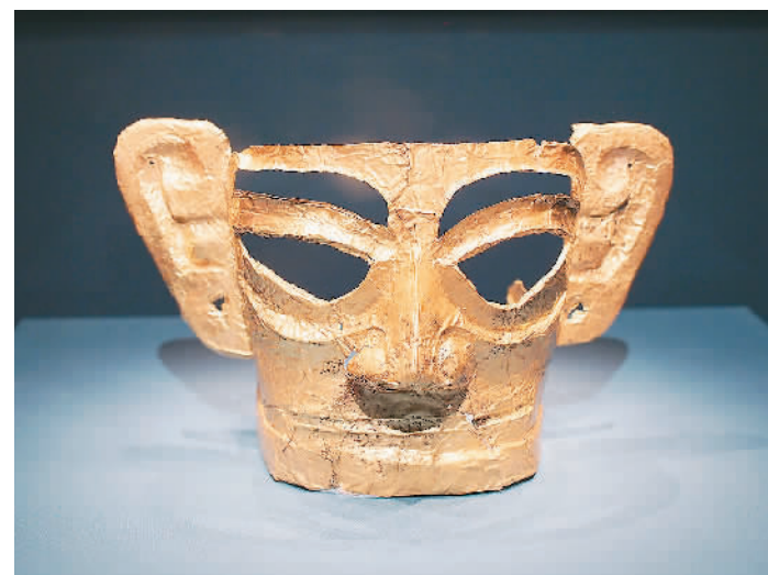
三星堆遗址三号坑出土的金面罩。

“中国陶都 世界陶醉”，宜兴不断擦亮紫砂文化名片，弘扬“陶式生活”方式，让古老陶艺焕发时代光彩，让千年文脉不断传承赓续。