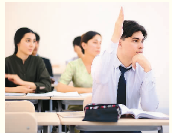
日前，在塔吉克斯坦首都杜尚别，学生在塔吉克斯坦民族大学孔子学院课堂听课。

2017年，获得孔院奖学金资助的马哈茂多夫，来到中国学习汉语国际教育专业。留学期间，他通过汉语水平考试6级，还在胡占德开办了旅行社，并在济南设立办事处。