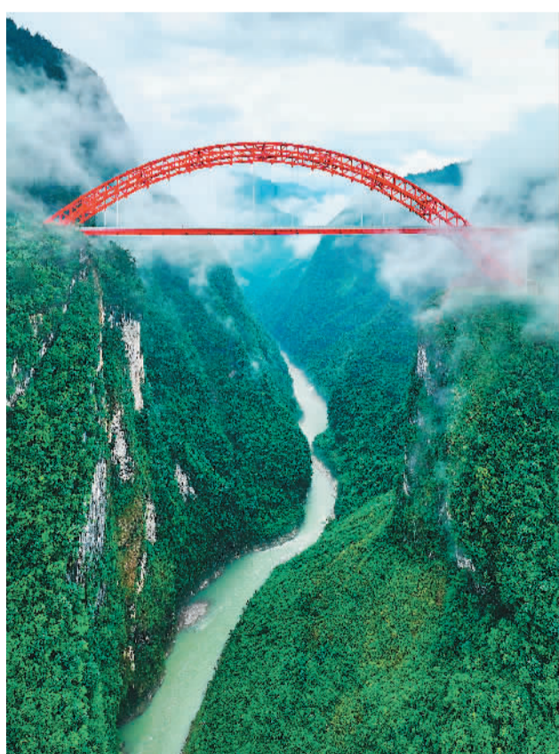
由湖北交投投资建设的溇水河特大桥位于湖北省恩施土家族苗族自治州鹤峰县境内，是宜来高速公路鹤峰东段的控制性工程。大桥全长328米，横跨300多米深的峡谷，施工难度极大，目前大桥建设全部完工。

与会外方代表祝贺中方成功举办本次会议，高度评价中方引领全球共同发展，愿共同推动全球发展倡议走深走实，为加快落实联合国2030年可持续发展议程提供重要推动力。