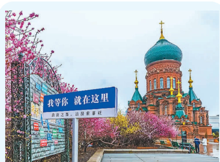
哈尔滨市索菲亚广场上鲜花盛放。