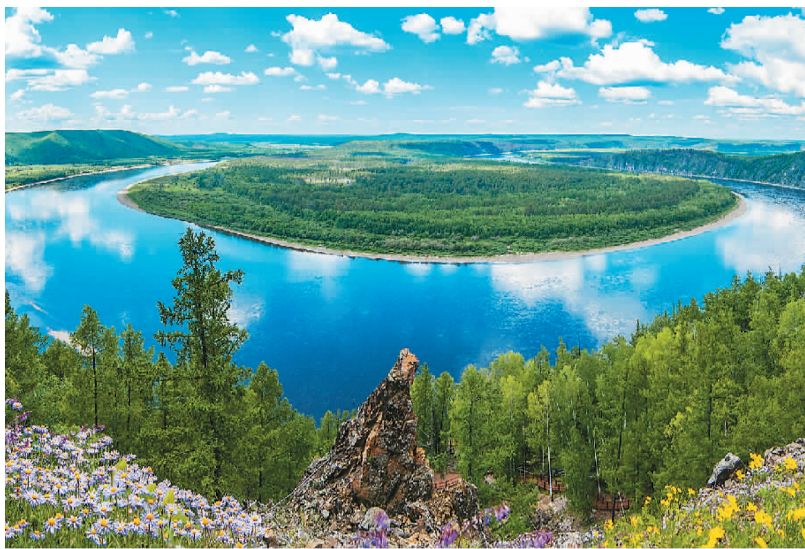
黑龙江第一湾景区位于大兴安岭地区，黑龙江流经此处自然形成长约30公里的“Ω”形大湾，景观独特，气势磅礴。

入夏以来，全国多地持续高温，而位于中国最北端的黑龙江省，夏季平均气温22℃，天赐“凉”机，成为众多游客心目中的避暑胜地。