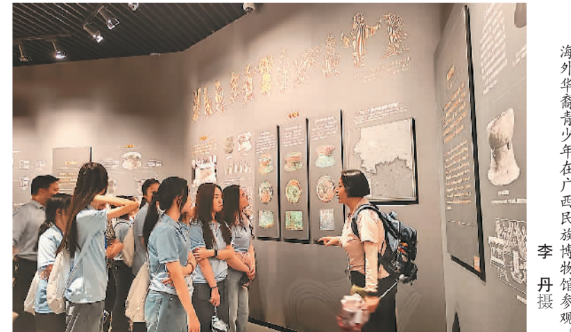
海外华裔青少年在广西民族博物馆参观。

活动期间，他们进行了“学中文·讲故事”主题大赛优秀作品现场展示，学习了四大名著之一的《西游记》等相关文化课程，并到广西民族博物馆、南宁青秀山风景区、桂林象鼻山、桂林两江四湖等地进行文化考察，实地感受广西经济建设发展成果和乡村全面振兴成效，进一步了解广西的悠久历史和独特的民族文化。通过沉浸式的学习体验，海外华裔青少年领略了中华文化的博大精深和深厚魅力。