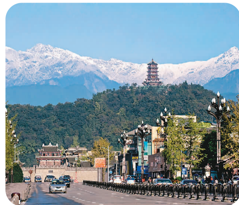
雪山下的公园城市——都江堰。