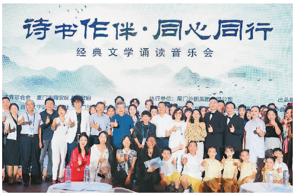
图为两岸嘉宾在“诗书作伴·同心同行”经典文学诵读音乐会上合影。

由中国作协港澳台办公室、福建省文联、厦门市翔安区人民政府、南京市台办联合主办的“2024两岸文学论坛暨青年文学交流活动”近日在福建厦门、江苏南京两地举办，140多名两岸作家和文学青年在6天时间内，围绕中华文化与文学创作展开交流。