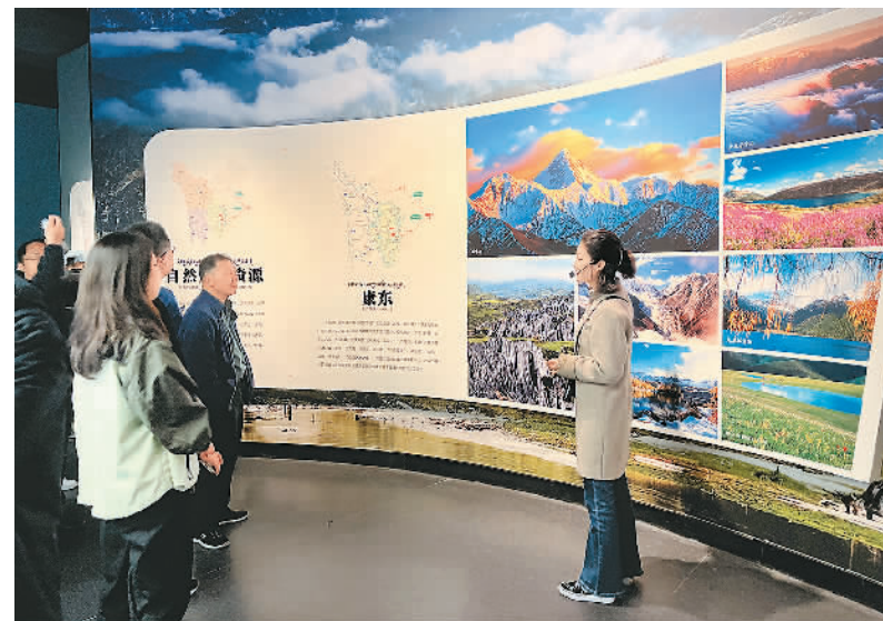
图为海外及海峡两岸媒体记者在参观甘孜藏族自治州博物馆。

本报甘孜7月11日电（记者柴逸扉）由中国和平统一促进会组织的海外及两岸华文媒体采风活动近日在四川省甘孜藏族自治州启动，来自美国、加拿大、埃及、肯尼亚等国家和海峡两岸的新闻媒体记者一行约30人参加活动。期间，采风团将一同走进高山峡谷、草原森林，体验甘孜的大美风光；探访藏族同胞聚居区，了解当地民族团结、经济发展、社会和谐的新貌。