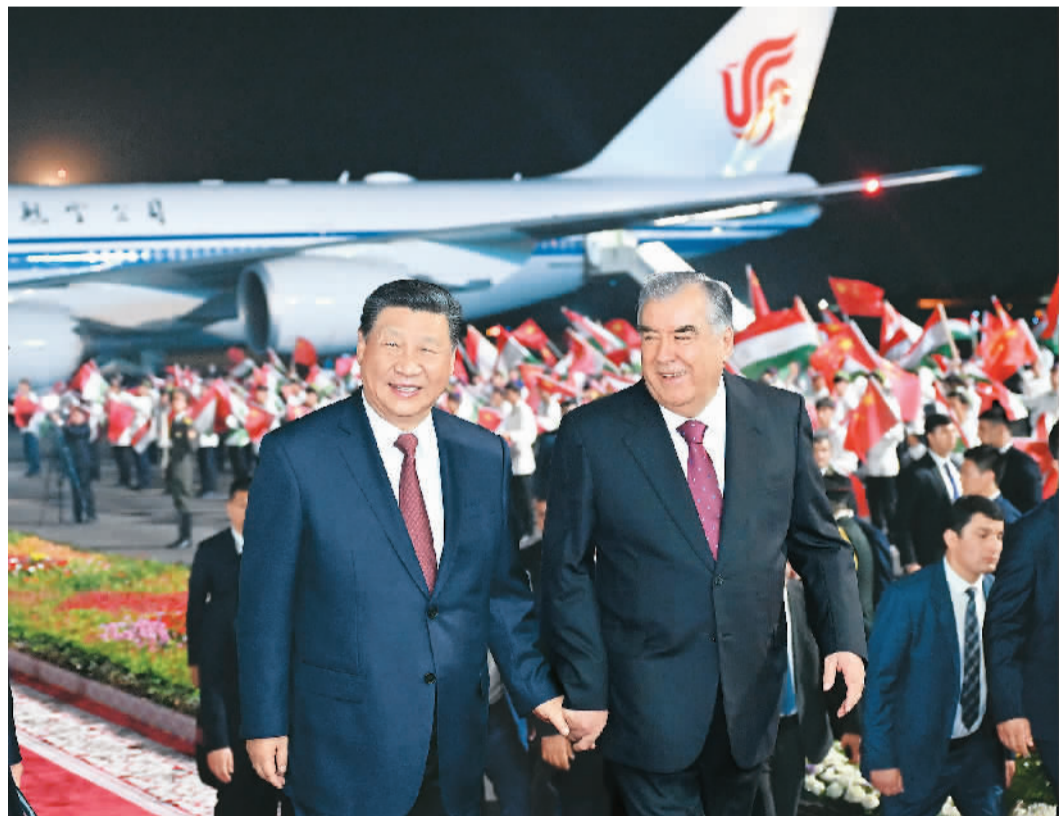
当地时间七月四日晚,国家主席习近平乘专机抵达杜尚别,应塔吉克斯坦共和国总统拉赫蒙邀请,对塔吉克斯坦进行国事访问。拉赫蒙在机场为习近平举行盛大隆重的迎宾仪式。

本报杜尚别7月4日电 (记者杜尚泽、曲颂) 当地时间7月4日晚,国家主席习近平乘专机抵达杜尚别,应塔吉克斯坦共和国总统拉赫蒙邀请,对塔吉克斯坦进行国事访问。塔吉克斯坦总统拉赫蒙率议会两院院长兼杜尚别市长鲁斯塔姆、外长穆赫里丁等高级官员热情迎接。塔吉克斯坦儿童向习近平献花,用中、塔文欢迎习近平到访。 (下转第四版)