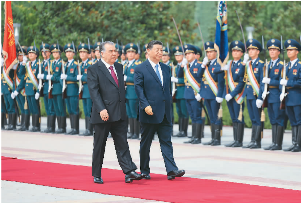
当地时间七月五日下午,国家主席习近平同塔吉克斯坦总统拉赫蒙在杜尚别总统府举行会谈。拉赫蒙为习近平举行盛大隆重的欢迎仪式。这是习近平在拉赫蒙陪同下检阅仪仗队。