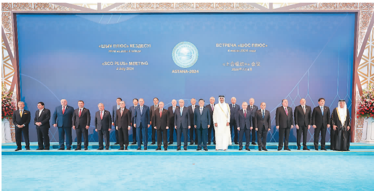
当地时间7月4日下午, 国家主席习近平在阿斯塔纳出席“上海合作组织+”阿斯塔纳峰会并发表题为《携手构建更加美好的上海合作组织家园》的重要讲话。峰会开始前, 习近平出席托卡耶夫为与会代表团团长举行的欢迎宴会并集体合影。