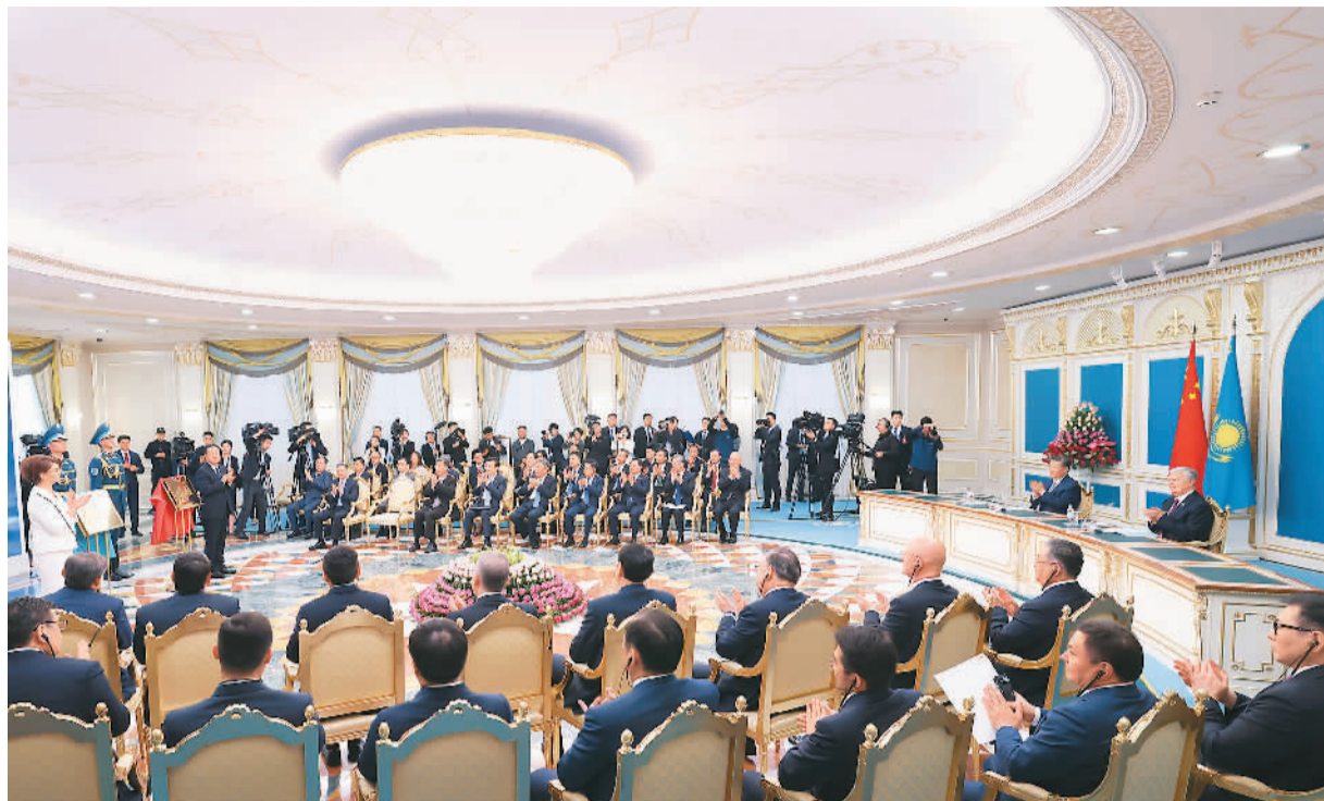
当地时间7月3日中午，国家主席习近平同哈萨克斯坦总统托卡耶夫在阿斯塔纳总统府共同出席阿斯塔纳中国文化中心、北京哈萨克斯坦文化中心和北京语言大学哈萨克斯坦分校揭牌仪式。