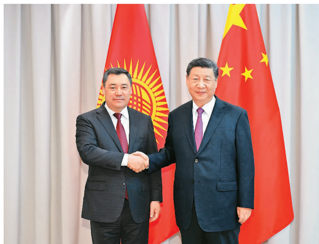
当地时间七月三日下午，国家主席习近平在阿斯塔纳出席上海合作组织峰会前会见吉尔吉斯斯坦总统扎帕罗夫。