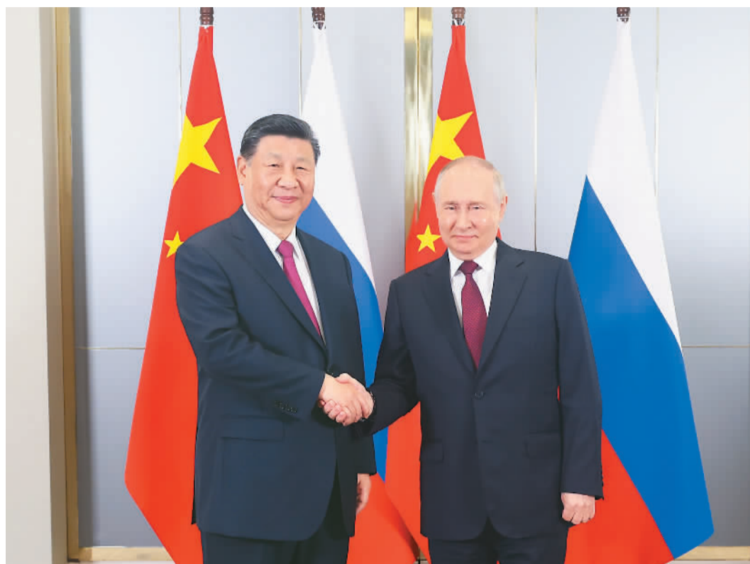
当地时间七月三日晚，国家主席习近平在阿斯塔纳出席上海合作组织峰会前会见俄罗斯总统普京。