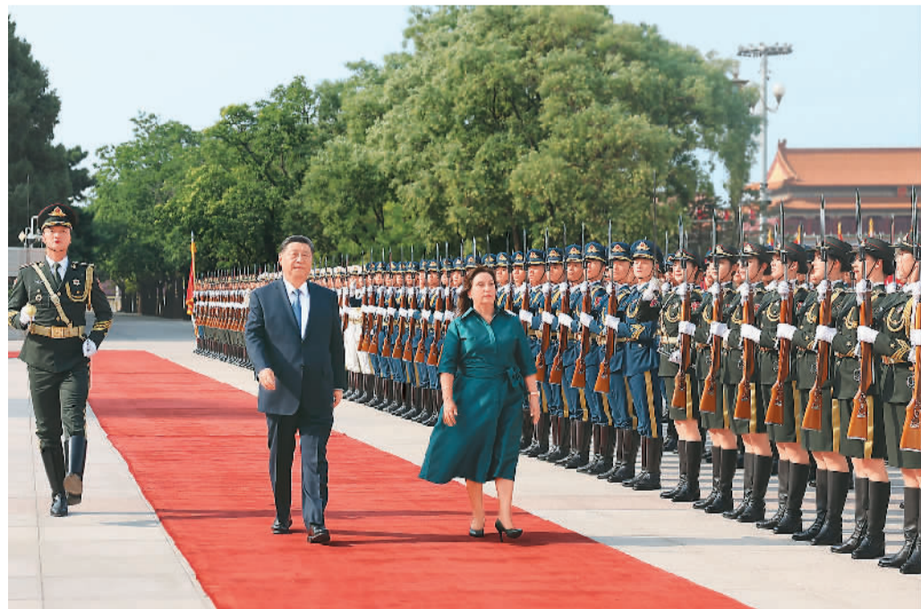
六月二十八日下午,国家主席习近平在北京人民大会堂同来华进行国事访问的秘鲁总统博鲁阿尔特举行会谈。这是会谈前,习近平在人民大会堂东门外广场为博鲁阿尔特举行欢迎仪式。