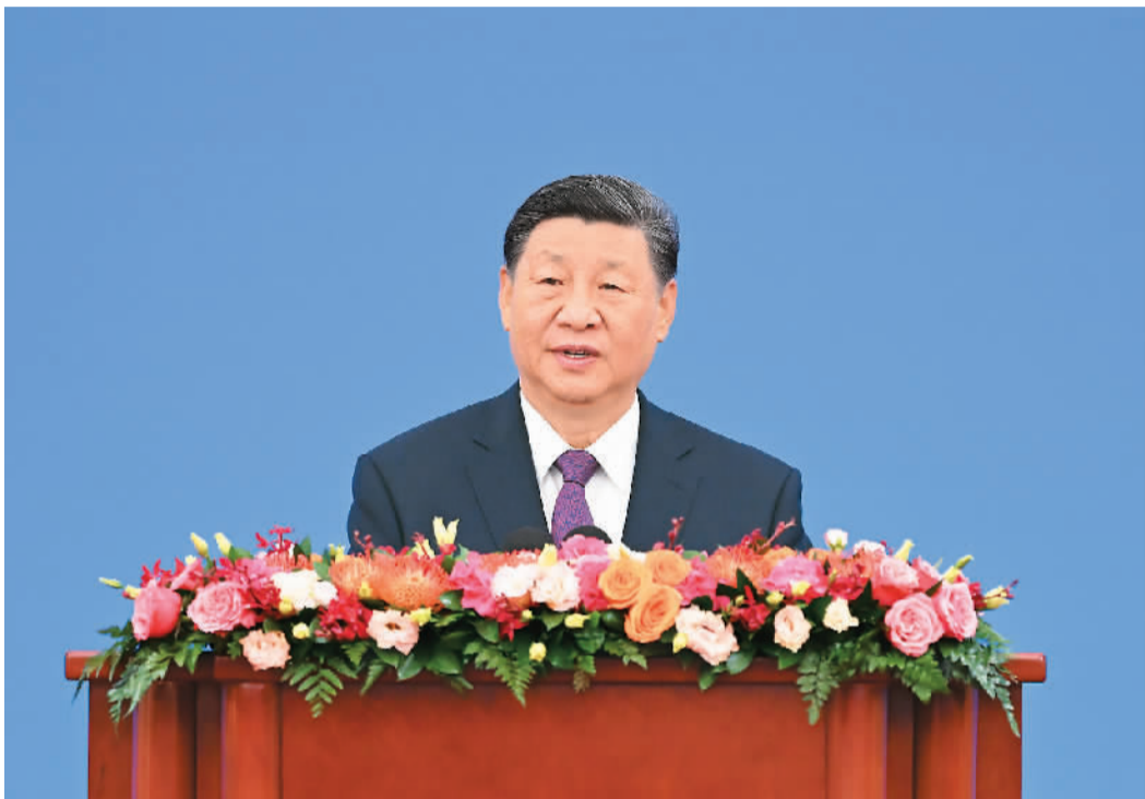
六月二十八日上午,和平共处五项原则发表七十周年纪念大会在北京人民大会堂隆重举行。国家主席习近平出席纪念大会并发表题为《弘扬和平共处五项原则,携手构建人类命运共同体》的重要讲话。