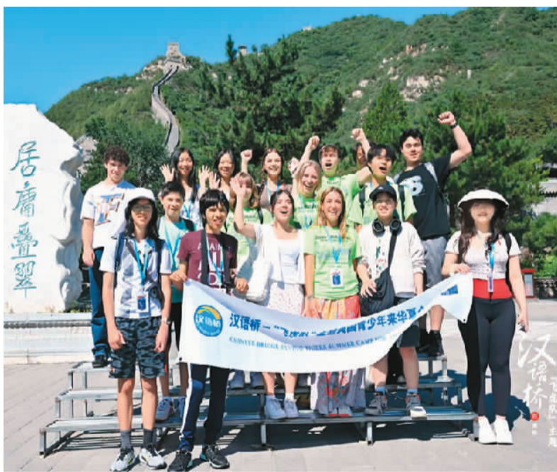
汉语桥——“飞虎队”主题美国青少年来华夏令营营员参观长城。

美中航空遗产基金会主席杰弗里·格林希望营员们能够珍惜和享受这段旅程，在中国度过充实且有意义的时光，把在中国的感受分享给更多人。