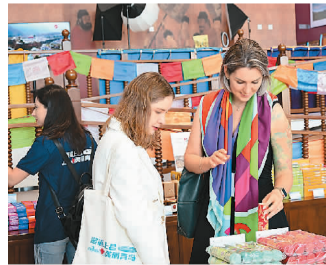
6月25日，来华留学生在位于山东青岛胶州的上合之珠国际博览中心参观。