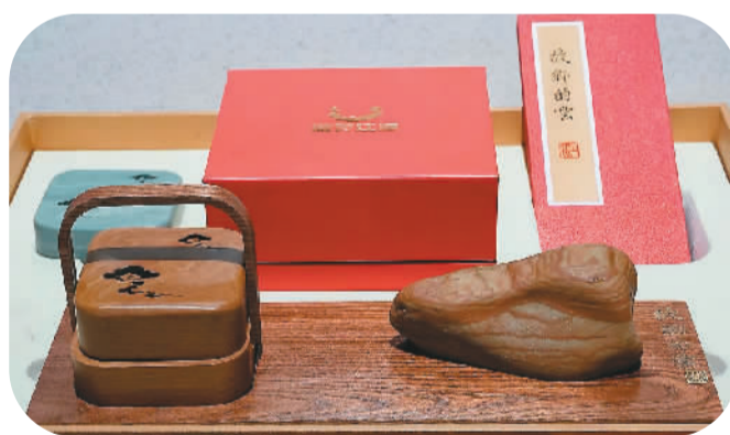
▲文创产品“故乡的云”。