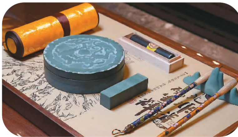
▶江源与浙江南浔联手打造的文化产品。