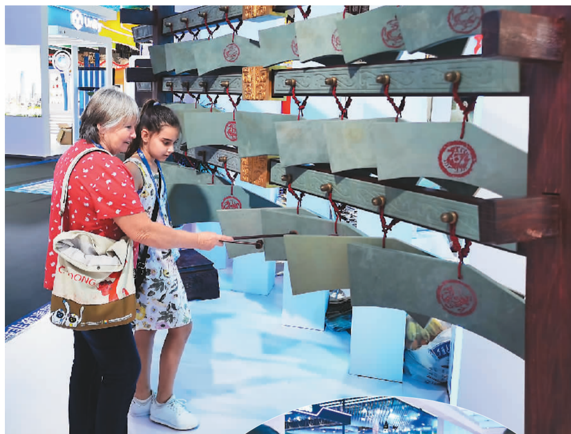
▲第二十二届中国（深圳）国际文化产业博览交易会上，外国嘉宾正在体验用松花石编磬演奏。