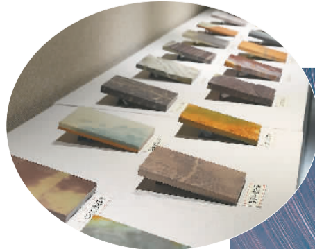
▲松花石博物馆展出的各种石料。