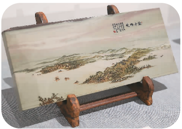
▲雕刻精美的松花石风景画。