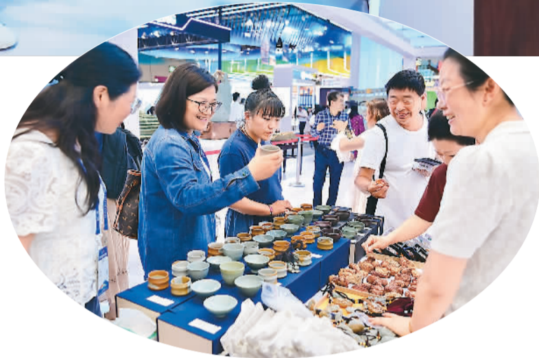
▲第二十二届中国（深圳）国际文化产业博览交易会上，中外嘉宾正在选购松花石工艺品。