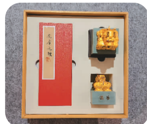
▲文创产品“耄耋之礼”。