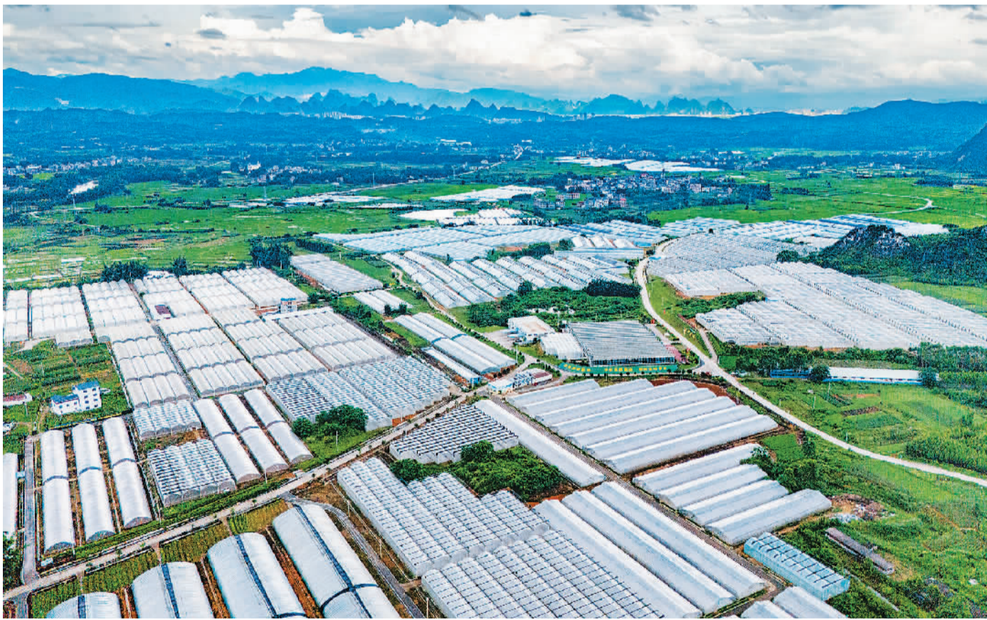
广西壮族自治区贺州市因地制宜发展大棚蔬菜产业，建成了广西集中连片最大的设施蔬菜产业长廊，打造粤港澳大湾区“菜篮子”高品质生产基地，为乡村全面振兴注入新动能。图为贺州市平桂区现代农业产业园内整齐排列的蔬菜大棚。

去年7月1日，“港车北上”落地实施。香港与内地“硬联通”不断升级。这样的持续升级，大大便利了香港与内地各省市进行文旅交流和经贸合作。