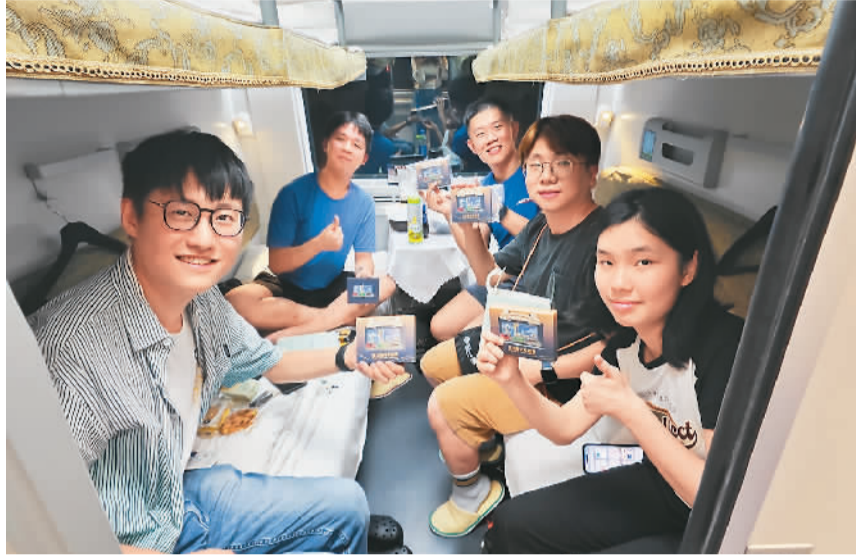
乘客在D908次列车上合影留念。

“由香港到北京、由夜晚睇(看)早晨、由缤纷团体活动到独享窗外风景，一起体验这趟有温度又有活力的精彩动卧之旅。一起出发，go!”香港特区政府运输及物流局局长林世雄近日在网上发出视频日志，向香港和内地的朋友力荐新开行的夕发朝至高铁动卧列车。