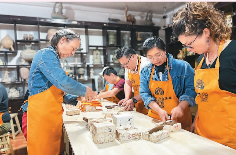
法国旅行商在西安体验兵马俑复制。