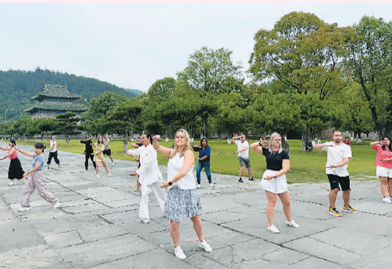
新西兰旅行商在武当山学习太极拳。