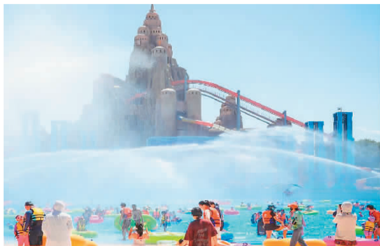
市民和游客在北京玛雅海滩水公园游玩。

据了解,北京玛雅海滩水公园是华侨城欢乐谷公司布局运营的12座水上乐园,1998年第一座玛雅海滩水公园在深圳开园,此后,武汉、上海、天津、重庆、南昌、南京、顺德、襄阳、西安、衡阳先后建起玛雅