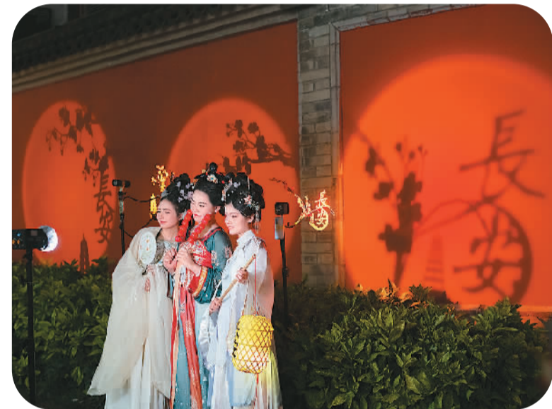
在西安大唐不夜城景区,身着汉唐服饰的游客在拍照。