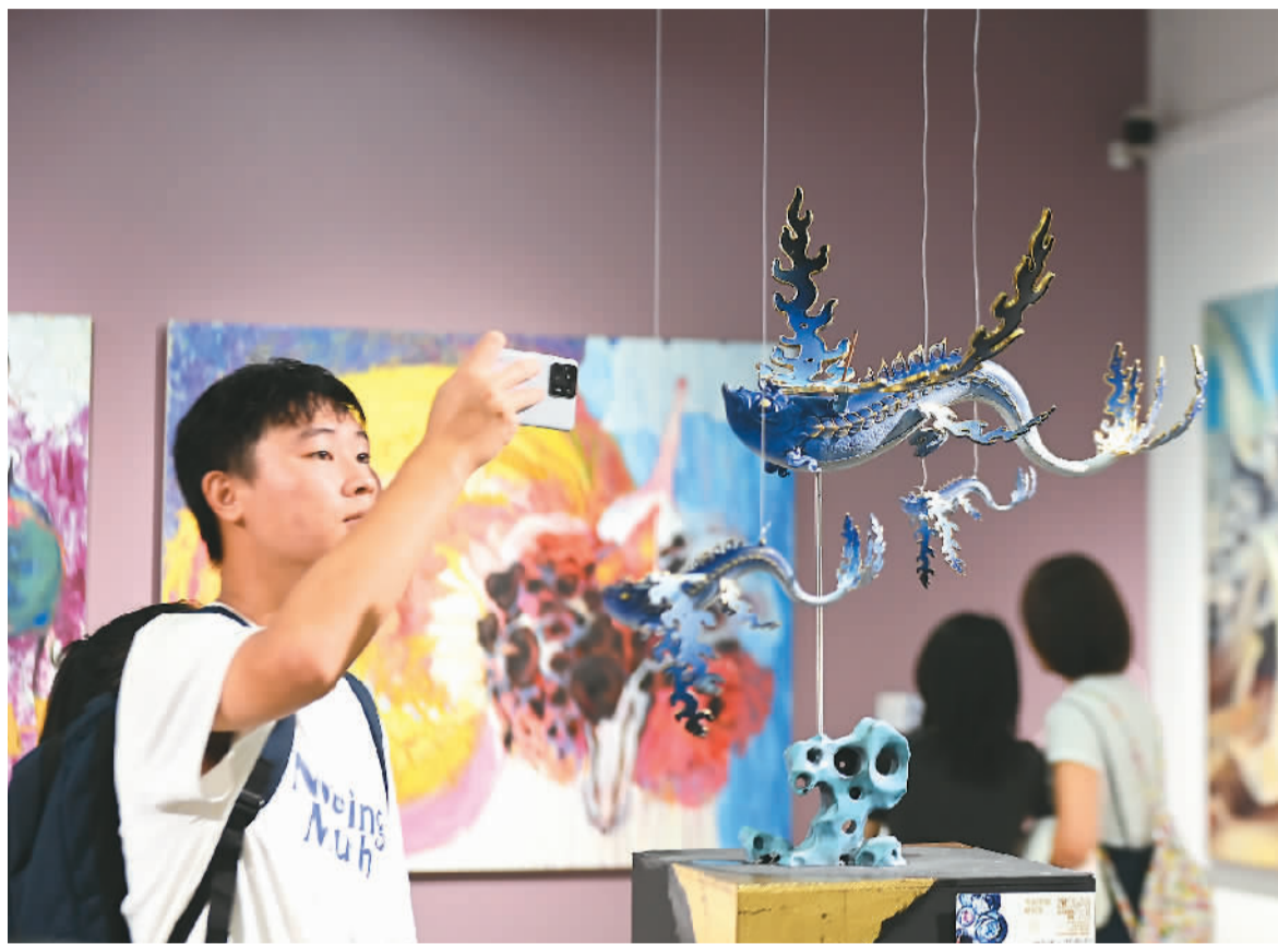
观众参观第二十届“开放的六月——四川美术学院艺术游”2024毕业作品展。

每年的毕业展都是各大艺术院校毕业生展示学习成果与才华能力的重要舞台。近期，全国各大艺术院校2024届毕业作品展陆续亮相。展出的毕业作品，既包括中国画、油画、版画、壁画、雕塑、水粉、水彩等传统艺术门类，也有装置、影像、行为、观念艺术等现代艺术形式，体现了00后美术学子丰富多元的创作取向。青年美术学子泼墨挥毫，挥洒青春热情，用作品书写内心之感，记录社会之变，反映时代之美。