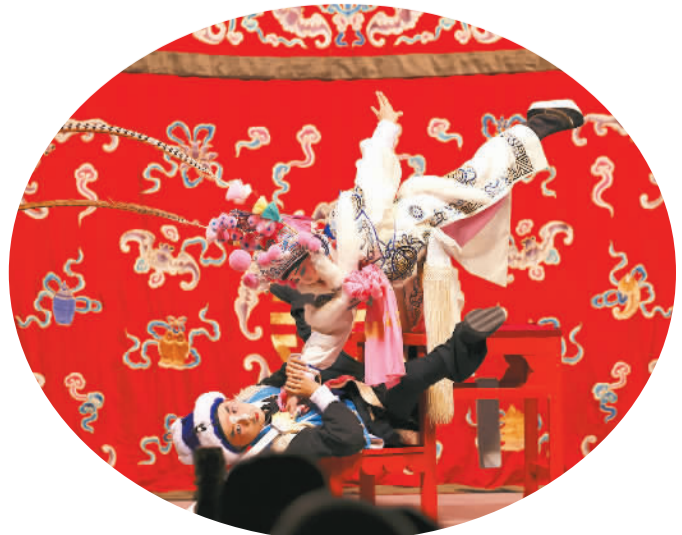
《牡丹亭》江苏省昆山市石牌中心小学学生表演