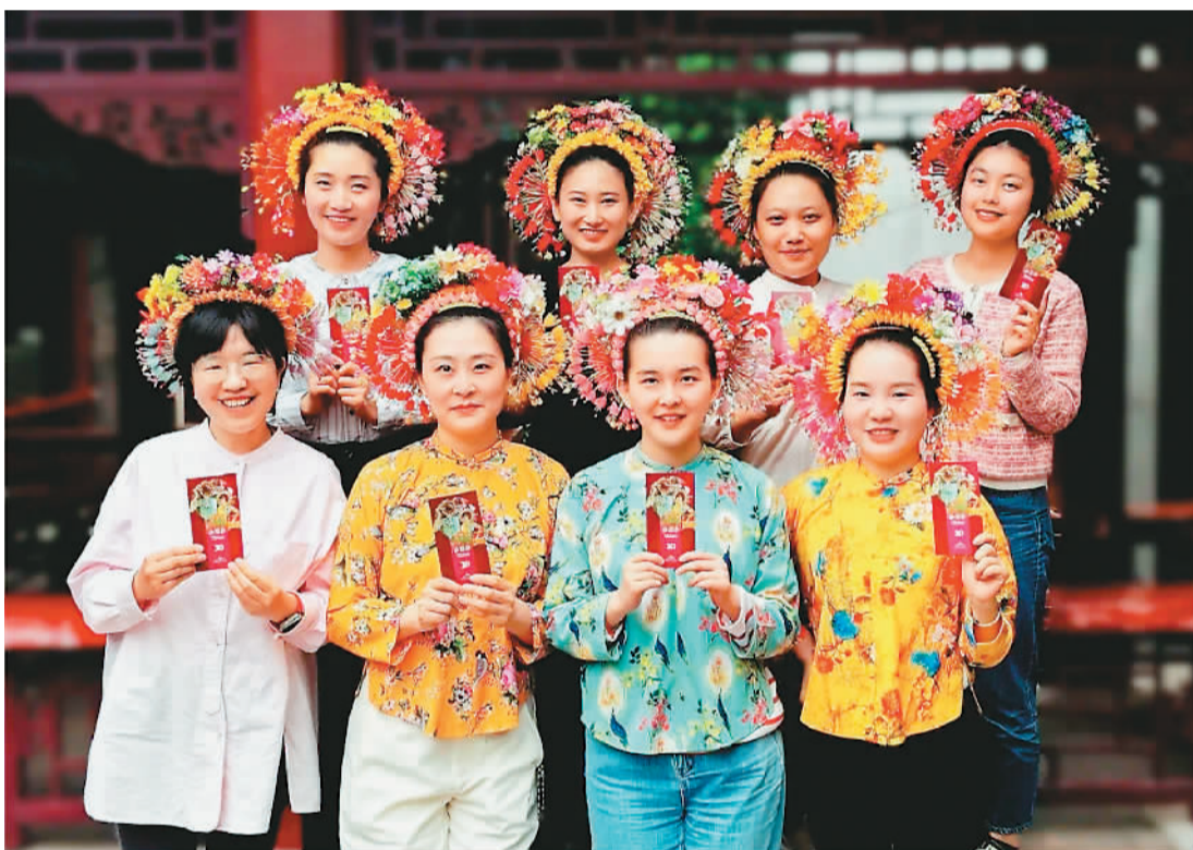
中国华侨历史博物馆举办“簪花游侨博”社教活动。