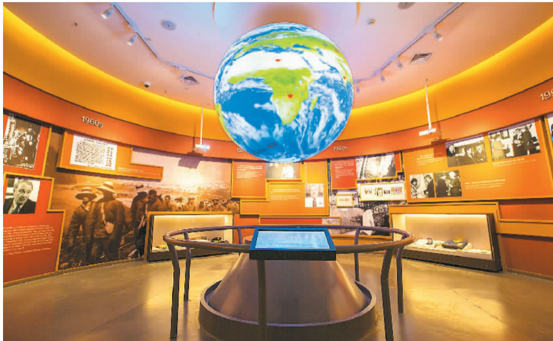
中国华侨历史博物馆基本陈列展厅。