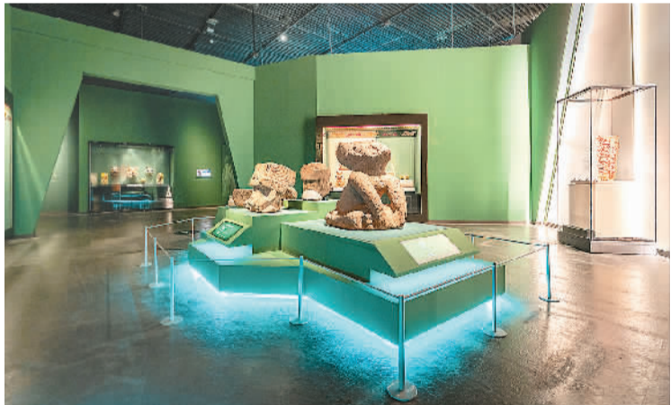
“寻踪美洲豹：墨西哥古代文明展”现场。