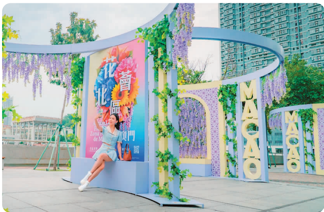
近日，澳门特区政府经济及科技发展局在北區街頭推出“奇夢拱筑”与“细说花语”两组大型花卉艺术装饰，以各类花卉打造出巨型拱门和纱帘等造型，吸引许多市民和游客拍照打卡。图为市民与花卉艺术装饰合影。