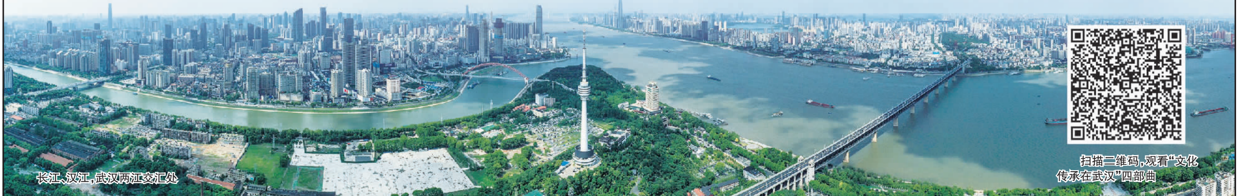
长江、汉江，武汉两江交汇处