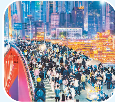
重庆千厮门大桥上游人如织，处处升腾着烟火气。

漫步大足石刻宝顶山景区，使节们被精美的石刻造像深深吸引。他们聆听了有关大足石刻保护传承的故事，沉浸在这些石刻所富含的深厚文化内涵和历史底蕴中。