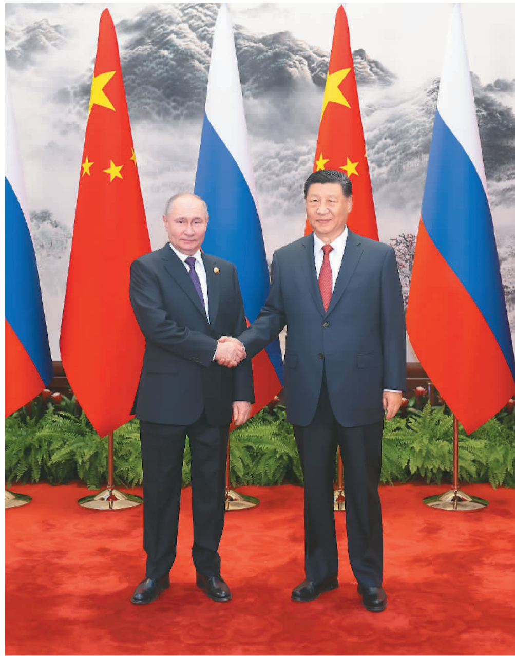
5月16日上午, 国家主席习近平在北京人民大会堂同来华进行国事访问的俄罗斯总统普京举行会谈。这是习近平同普京握手。