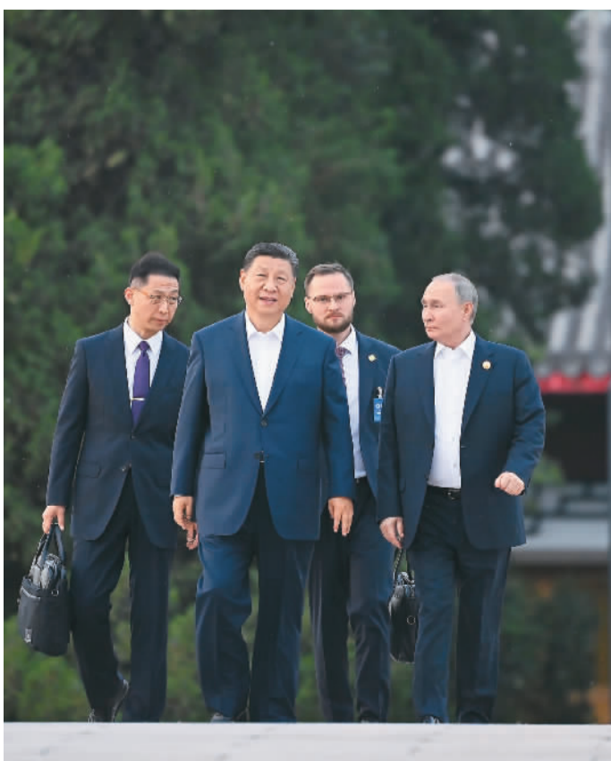
5月16日晚, 国家主席习近平在北京中南海同俄罗斯总统普京举行小范围会晤。

习近平阐述了中方一贯立场以及为推动政治解决乌克兰危机所作努力, 强调处理任何重大问题既要治标, 也要治本; 既要谋当下, 也要计长远。我提出全球安全倡议, 核心是倡导共同、综合、合作、可持续的安全观。解决乌克兰危机的根本之策是推动构建均衡、有效、可持续的新型安全架构。中方支持适时召开俄乌双方认可、各方平等参与、公平讨论所有方案的国际和会, 推动早日政治解决乌克兰问题, 愿继续为此发挥建设性作用。 (下转第四版)