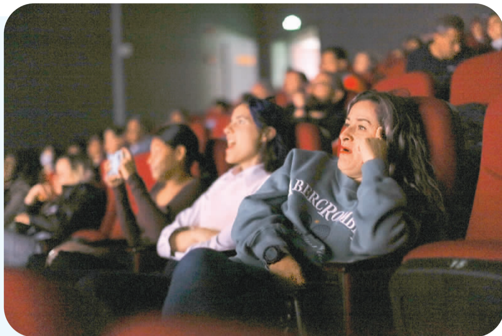
上图:外籍记者观看《雪豹和她的朋友们》影片。

随着场内灯光逐渐暗下,一座肃穆的雪山在屏幕上浮现,野生动物纪录片电影《雪豹和她的朋友们》观影活动拉开帷幕。电影拍摄历时6年,由当地牧民深度参与,真实拍摄的雪豹故事深深打动了观影者。影片放映结束后,外籍记者与中方主创团队就生态环境保护、人与自然和谐共处等议题展开热烈交流。中国的雪豹故事走进外籍记者的心中,也将继续随着他们的述说走向世界。