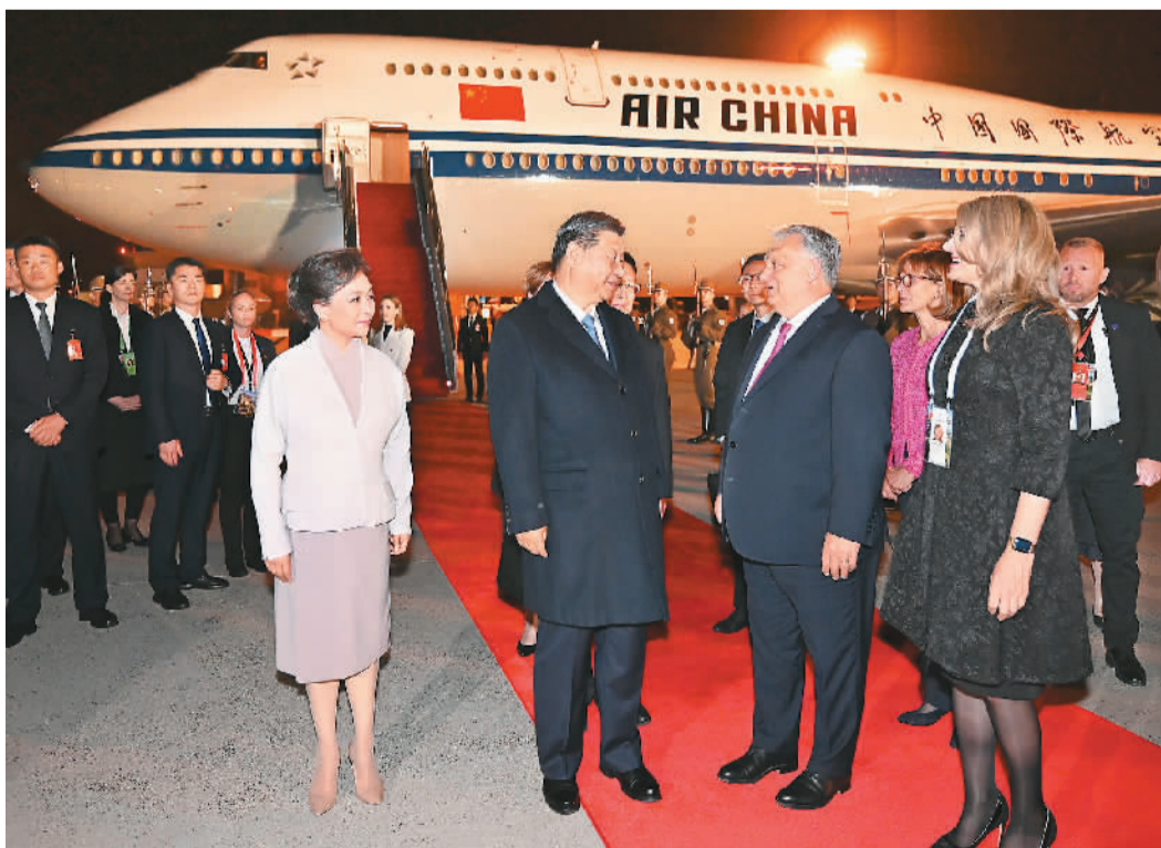
当地时间五月八日晚, 国家主席习近平乘专机抵达布达佩斯, 应匈牙利总理欧尔班夫妇和总理欧尔班邀请, 对匈牙利进行国事访问。