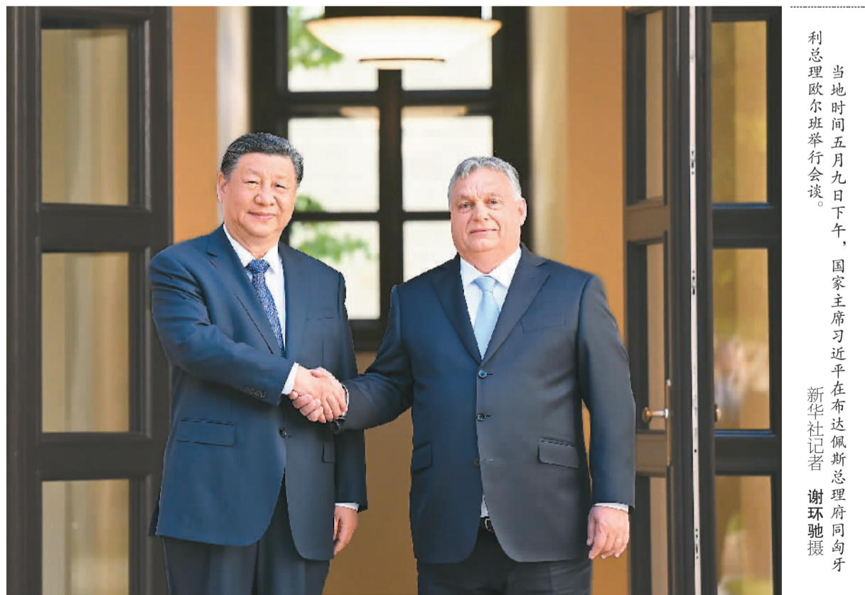
当地时间五月九日下午, 国家主席习近平在布达佩斯总理府同匈牙利总理欧尔班举行会谈。