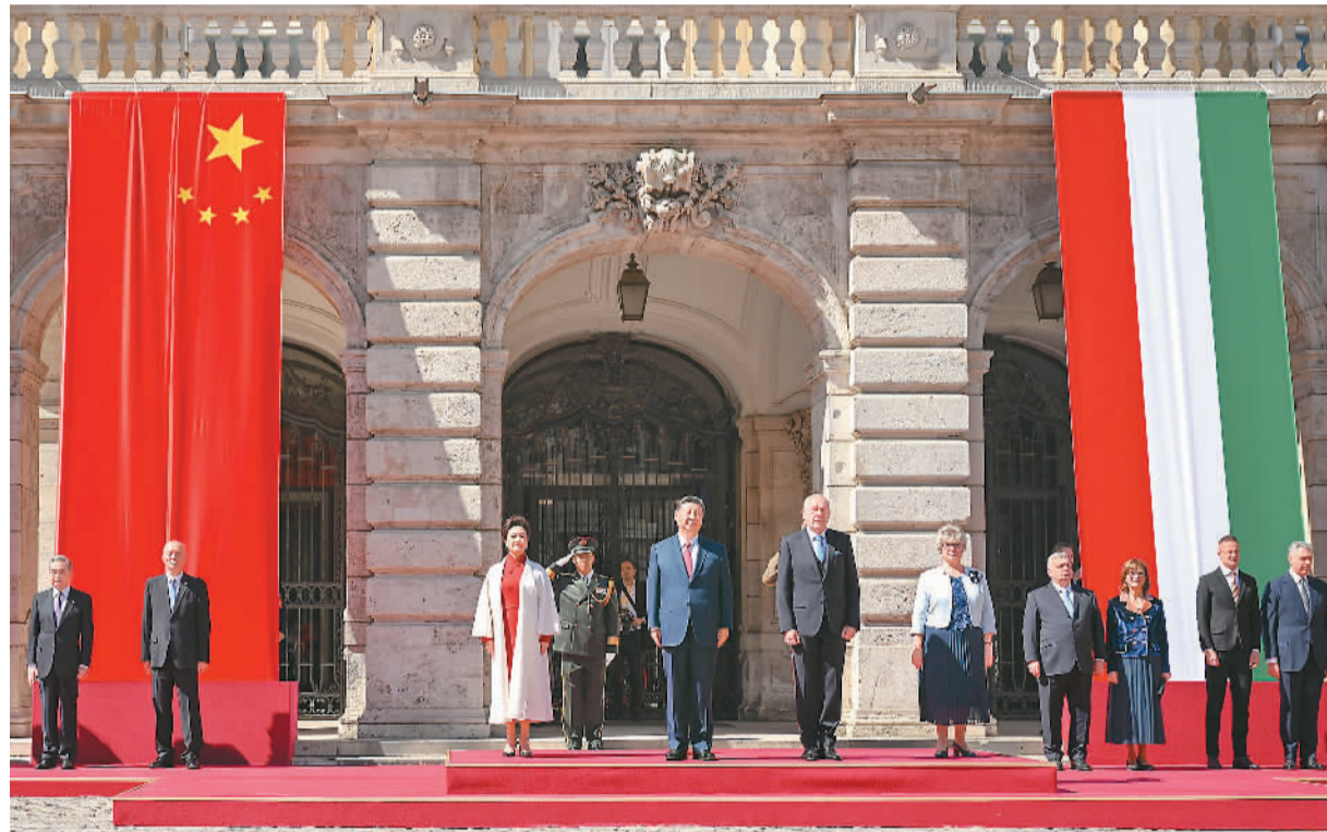
当地时间5月9日上午, 国家主席习近平在布达佩斯出席匈牙利总统舒尤克和总理欧尔班共同举行的隆重欢迎仪式。