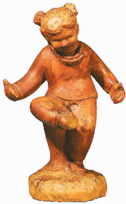
▲ 踢毽子 (雕塑) 刘开渠