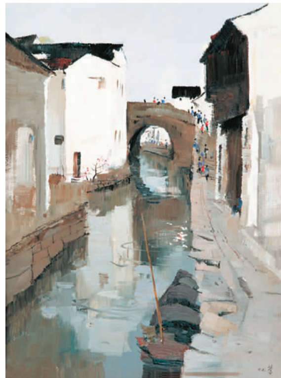
▲ 绍兴河滨 (油画)

当时，留法艺术家大多在巴黎国立高等美术学院学习，以油画、素描、雕塑为主要研究科目。在这