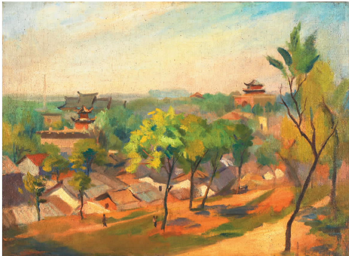
▲ 鼓楼远眺 (油画)