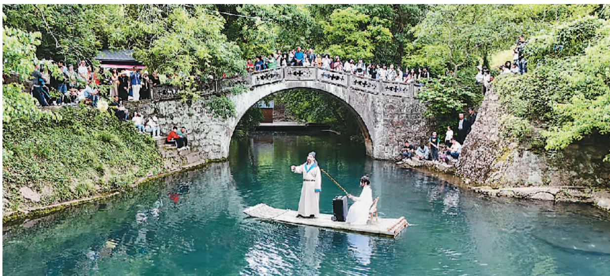
“五一”假期，湖北省当阳市花溪湿地开展沉浸式文旅活动。图为游客与演员扮演的李白互动对诗。

为了满足假日游客出游需求，全国各地深度融合文旅资源，积极推出各类优质文化活动，为游客带来丰富多彩的假日体验，给今年的“五一”假期带来了浓浓的文化气息。有网友留言称：“‘诗与远方’就在我身边。”