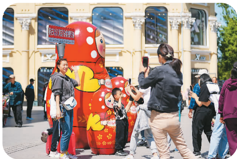
5月2日，游客在黑龙江省哈尔滨市中央大街上留影。

新华网关注传统景区的“新鲜味”。报道称，从北京故宫到杭州西湖，从成都春熙路到西安大唐不夜城，传统旅游景区成为游客的热门选择。携程数据显示，北京市、上海市、杭州市、西安市等大城市仍旧占据热门目的地第一梯队。“每个城市仿佛都来了‘一亿人’！”网友的趣评，形象地反映各地人山人海、游客热情高涨的场面。在江苏省南京市，包括渡江胜利纪念馆、六朝博物馆在内的南京市博物馆所属各场馆均延时开放；在浙江省杭州市，多条直通景区的地铁公交接驳线开通；在重庆，78条特色旅游体