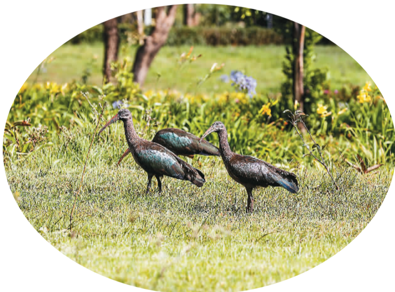
▲ 友谊广场上的凤头鸕。 ▼ 友谊广场的黄昏景色。