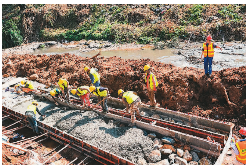
▲ 2019年10月27日，工人们在友谊广场河道施工现场作业。