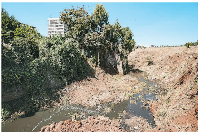
▲ 2019年2月27日，改造前的友谊广场所在地。