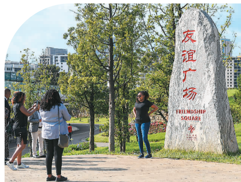
▲ 游客们在友谊广场纪念碑前拍照留念。 ▼ 小朋友在友谊广场玩跷跷板。

援埃塞俄比亚河岸绿色发展项目是中国援建的市政园林类项目，是落实中非合作论坛北京峰会“八大行动”倡议“绿色发展”行动计划的具体举措。作为援埃塞俄比亚河岸绿色发展项目的组成部分，友谊广场是非洲功能最多、面积最大的城市综合广场之一。在经历了11个月工期的改造后，原来的一片荒地变成了深受市民们喜爱的城市新地标。