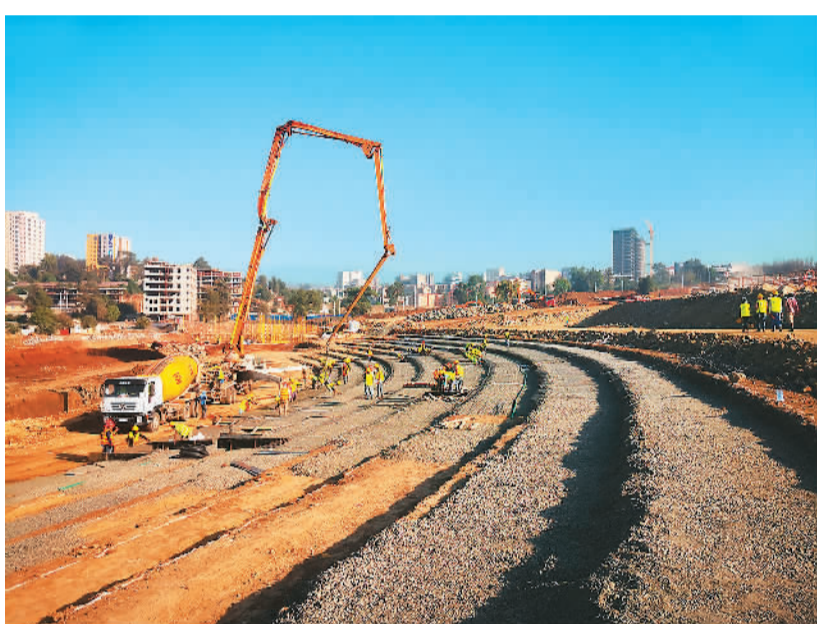
▲ 2019年12月6日，友谊广场施工现场。