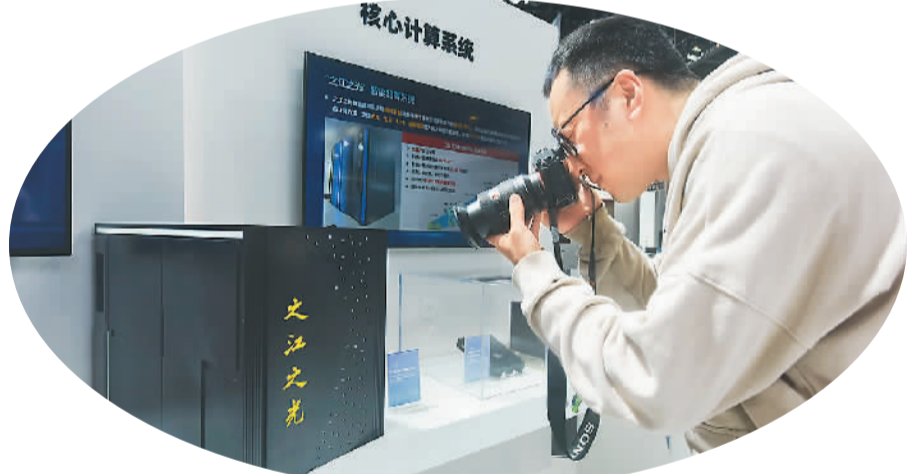
观众在2023第二届全球数字贸易博览会上拍摄“之江之光”超算装置模型。