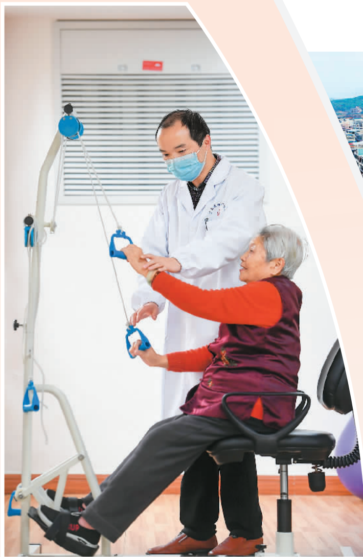
▲ 江西省宜春市袁州区，老年护理院的医护人员在陪老人做康复训练。

老有所养，让子女放心；幼有所育，让家长安心。期待更多更好“一老一小”的普惠服务助力人们的美好生活。