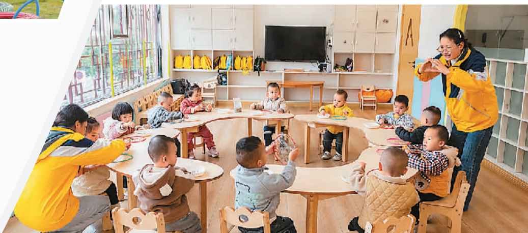
▲ 贵州省黔东南苗族侗族自治州天柱县积极推进社区普惠托育服务体系建设，托育中心开到“家门口”，让居民就近“托”得放心。图为在天柱县凤城街道新区社区新爱婴早教中心，老师引导小朋友做手工。