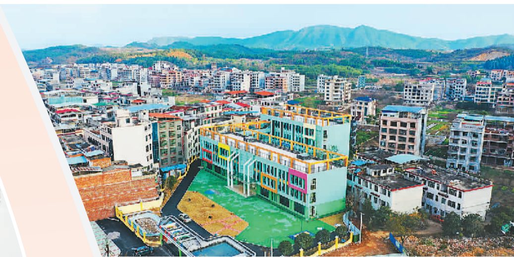
▲ 为满足老城区适龄儿童就近入学需求，湖南省永州市新田县新建晓日幼儿园，目前项目已基本完工，预计增加学前教育学位360个。图为晓日幼儿园建设现场。