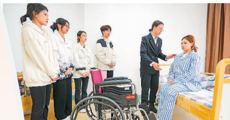
▲ 近日，福建省泉州市轻工职业学院智慧健康养老服务与管理专业的师生走进社会福利院，开展养老实训。图为老师给学生讲解照护失能老人技巧。