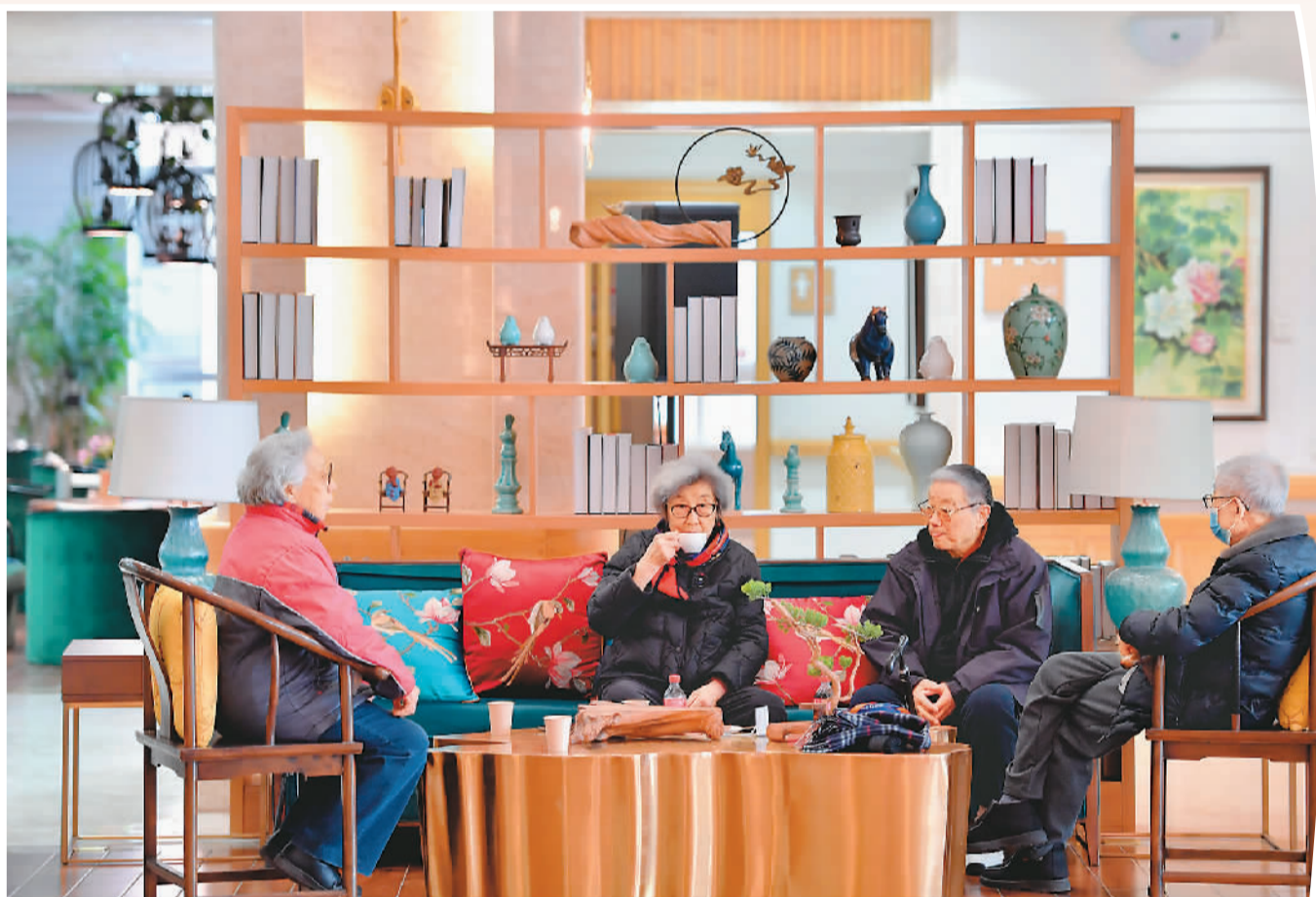
▲ 河北省廊坊市香河县加快布局医养康养产业，打造集养老护理、医疗康复于一体的养老示范基地，方便老人安享幸福晚年。图为几位老人在香河县大爱书院养老中心活动室休憩。