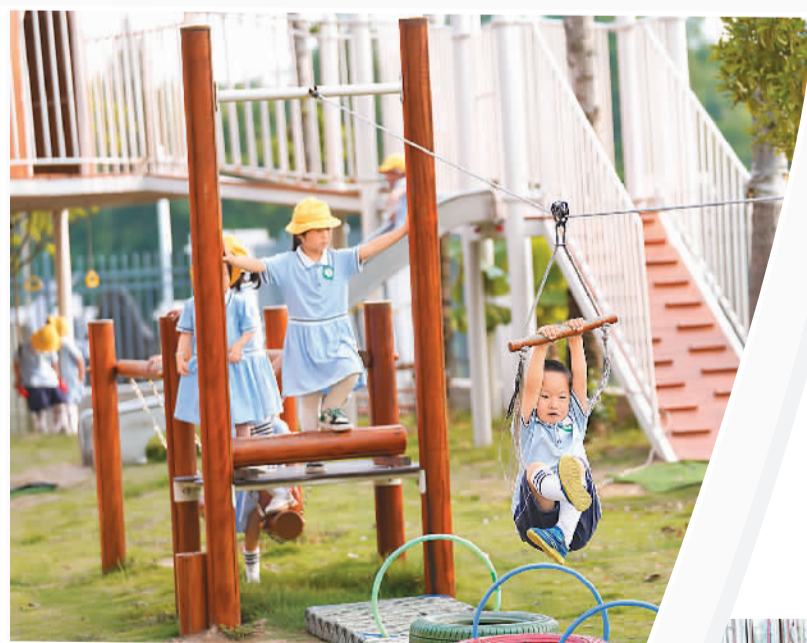
▲ 安徽省池州市洋浦幼儿园根据幼儿年龄特征，开设戏剧、舞蹈、骑行、烹饪等课后延时服务课程。图为孩子们在课后进行户外游戏。