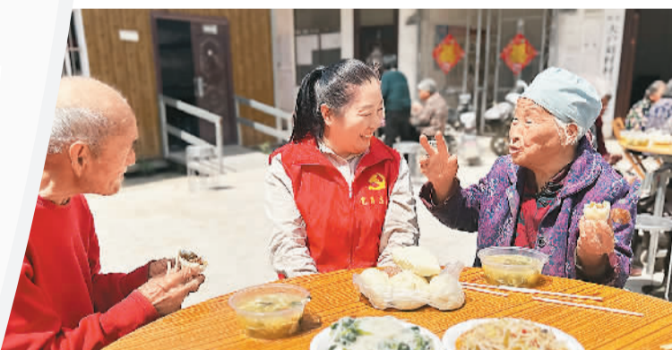
▲ 近日，山东省菏泽市鄄城县举办“孝老大食堂”志愿活动，目前已服务7000多人。图为志愿者陪同村里老人吃午饭、唠家常。