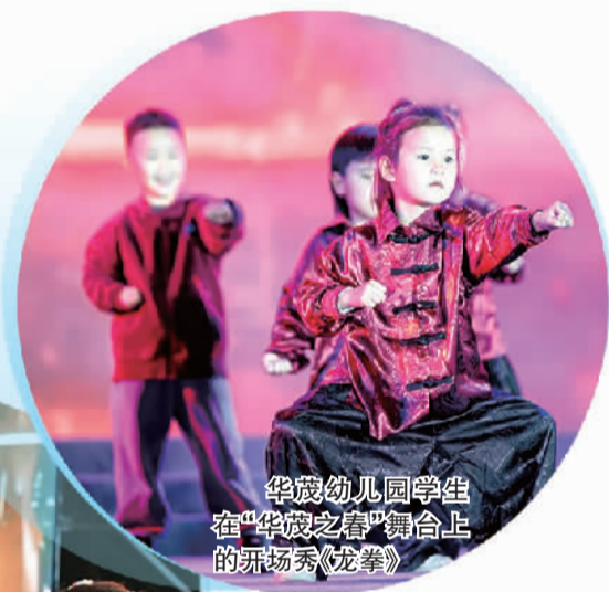
华茂幼儿园学生在“华茂之春”舞台上的表演秀《龙拳》