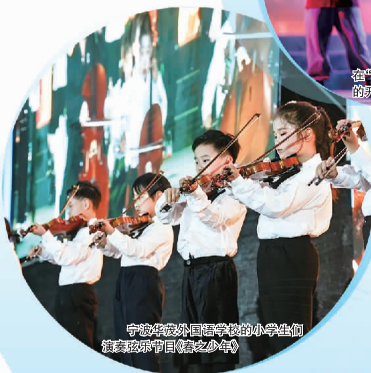
宁波华茂外国语学校的小学生们演奏弦乐节目《春之少年》