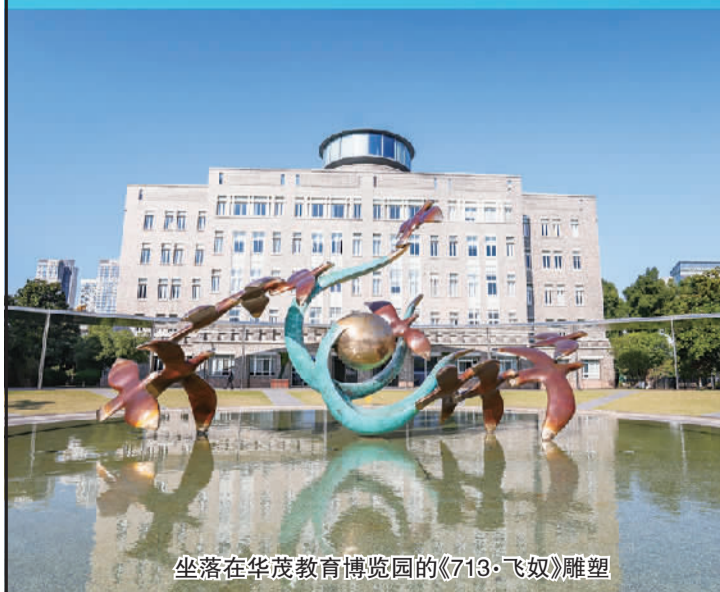
坐落在华茂教育博览园的《713·飞奴》雕塑