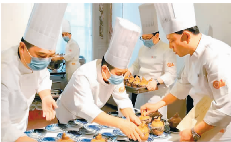
「你好中国——美食之夜」活动现场，中国烹饪协会法国美食交流考察团厨师正在备餐。

“2024年是中法建交60周年，是中法文化旅游年，也是巴黎奥运会举办年，这为法国中餐业提供展示和推广的机会，是中餐业进一步提升国际影响力的重要契机。”中国烹饪协会会长杨柳接受本报记者采访时说，“在这样的背景下，中国烹饪协会邀请国内杰出的餐饮企业家代表和来自福建省福州市、泉州市，广东省潮州市，广西壮族自治区桂林市，山西省太原