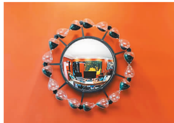
▲ 阿诺菲尼 (装置) 列思 (法)

艺术因交流而更加精彩。艺术家需要在广泛的交流中了解世界，吸收新的信息，收获新的感触，推动艺术创作向前走。这些交流活动开阔了我的视野，让我可以从更多角度去思考，去创作，我也更加自信了。期待未来有机会参加更多中外文化艺术交流交流活动。