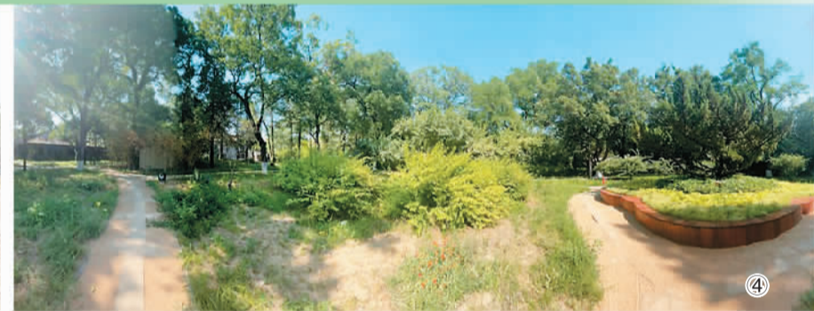
▼燕南园更新改造前(图①、图③)后(图②、图④)对比图。