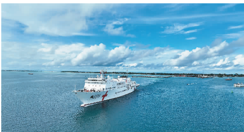
2023年7月22日,中国海军“和平方舟”号医院船结束对基里巴斯的访问驶离塔拉瓦港。

展之路;在2023年首届中国—中亚峰会上同中亚五国领导人探讨“携手建设一个远离冲突、永沐和平的共同体”;在2023年金砖国家工商论坛闭幕式上主张坚持共同、综合、合作、可持续的新安全观,走出一条普遍安全之路……两年来,习近平主席向世界多次阐述全球安全倡议的理念内涵和时代意义,获得国际社会广泛认同。全球安全倡议如今已得到100多个国家和国际地区组织的支持认同,写入多份中国与其他国家、国际组织交往合作的双边文件。