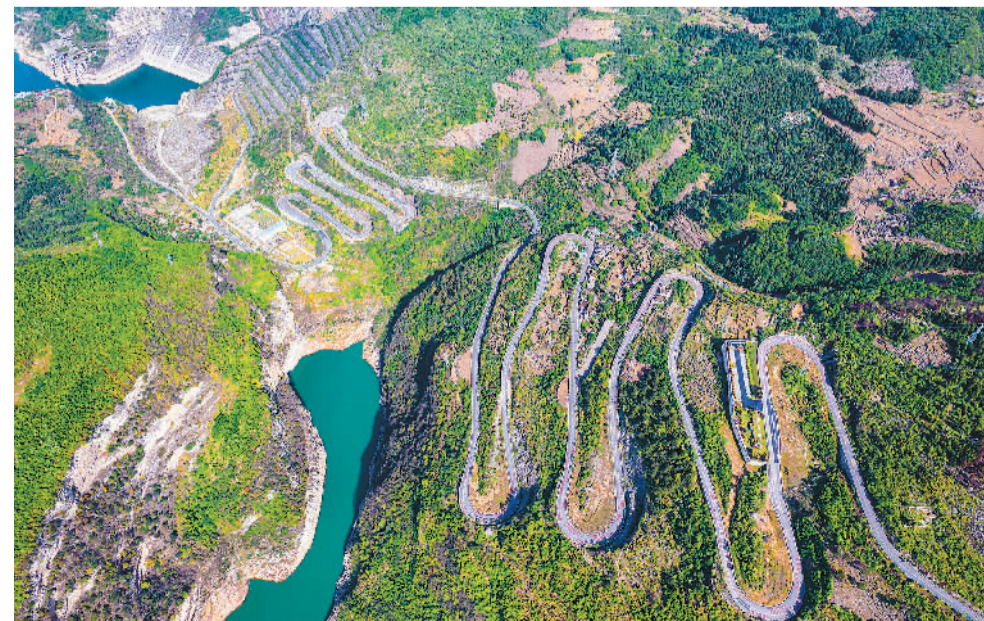
近年来,贵州省毕节市大力推进交通基础设施建设,不断优化城乡交通路网布局,构建起以高铁高速为骨架、国道省道为支撑、县乡公路为脉络的综合交通运输体系。 图为该市织金县八步镇境内提质改造后的321国道。

内蒙古二连浩特铁路口岸是中国中欧班列“中通道”的唯一出入境节点,目前运行线路已达71条,辐射范围延伸至10多个国家和140多个国内外城市或站点。