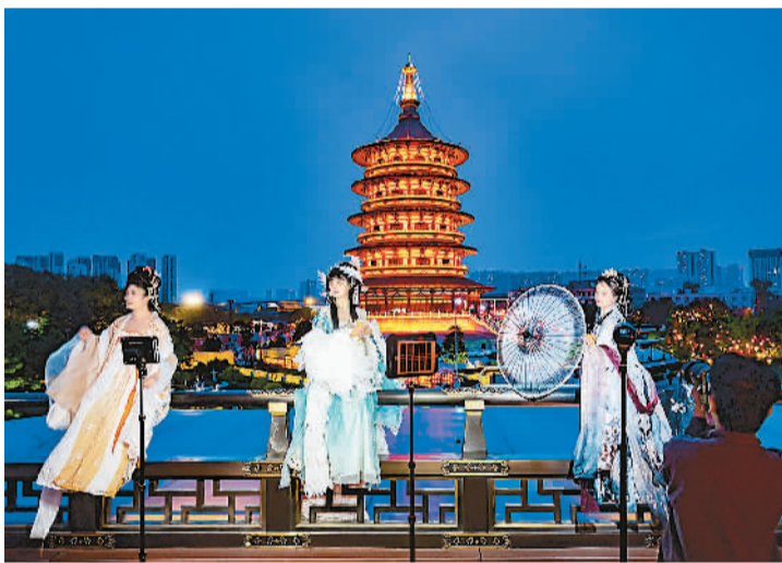
市民游客在河南省洛阳市隋唐洛阳城国家遗址公园游玩拍照。

继去年的淄博烧烤、柳州螺蛳粉后，今年麻辣烫又带火了天水。据去哪儿平台统计，自2月26日起，天水的搜索量逐步上升，搜索增速同比增长2000%。清明节假期，天水酒店预订量增长12倍。途家民宿数据显示，截至4月6日，天水民宿预订量同比增长18.8倍，大同民宿预订量同比增长18.5倍，淄博民宿预订量同比增长14.5倍，此外，锦州、汉中、徐州、宣