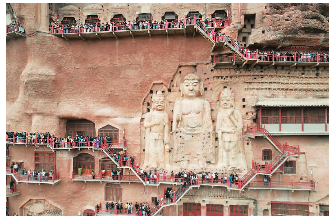
游客在甘肃省天水市麦积山石窟游览。（无人机照片）