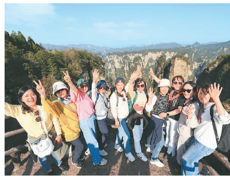
韩国游客在张家界国家森林公园黄石寨景区游览。