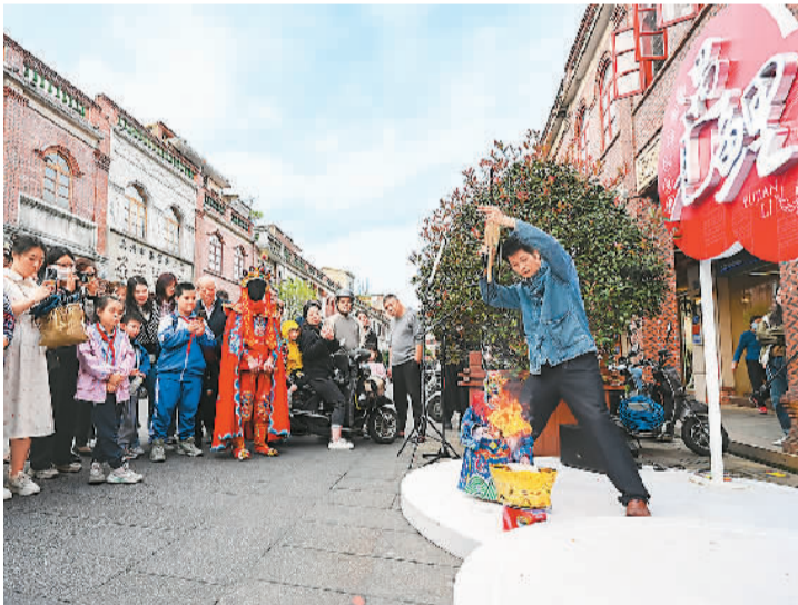
在泉州中山路，市民游客观看提线木偶表演。