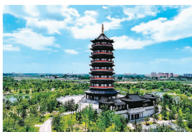
《京津冀·瓣瓣同心》剧照：河北雄安风光。