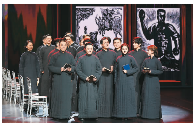
戏剧电影《抗战中的文艺》剧照。