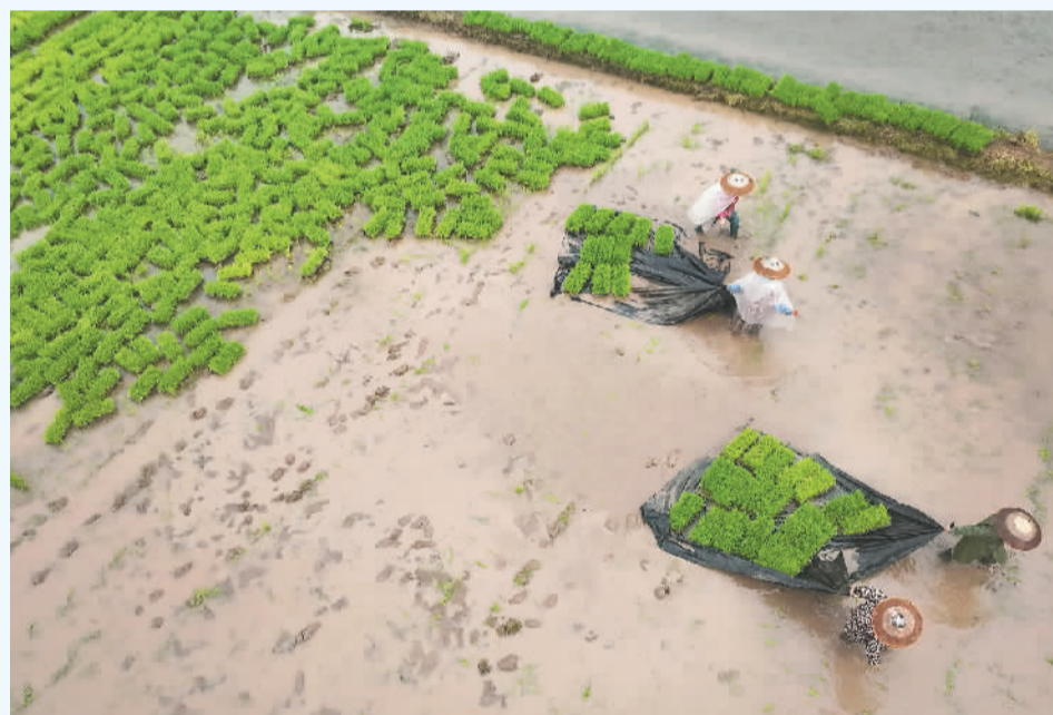
近日, 湖南省衡阳市祁东县金桥镇的农民抢抓农时开展早稻插秧工作。图为当地村民在转运秧苗。

目前, 全国大中型灌区的春灌工作已完成近两成。水利部将继续围绕春灌各个环节, 强化组织安排, 保障春灌有序实施。