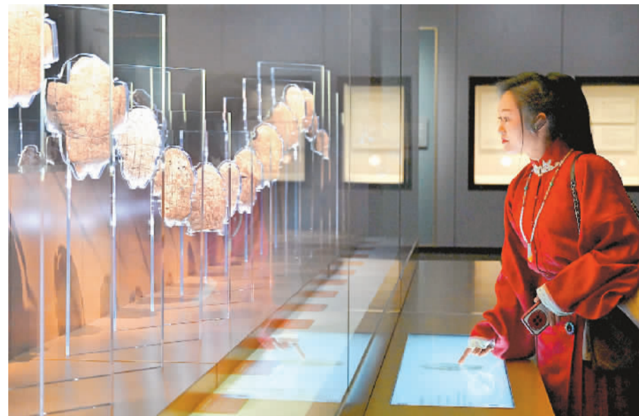
参观者在河南安阳殷墟博物馆新馆内观看展出的刻辞卜甲。