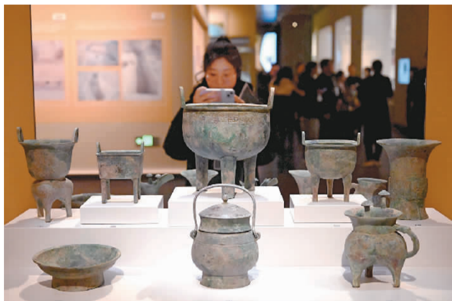
参观者在河南安阳殷墟博物馆新馆内拍摄展品。