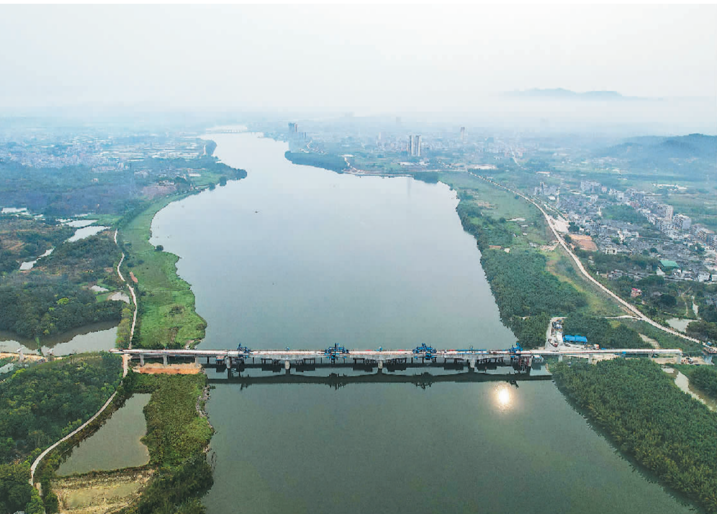
近日，由中铁四局承建的揭(阳)惠(来)铁路榕江南河特大桥主跨连续梁合龙。该桥全长1576.84米，是全线最长的跨水域桥梁。揭惠铁路位于广东省揭阳市内，起自梅汕铁路揭阳站，终至汕汕铁路惠来站。新建正线全长88.66公里，设计时速160公里，建成通车后将进一步完善粤东地区城际铁路网，密切与粤港澳大湾区以及东南沿海地区的联系。

福慧国际慈善基金会主席林卫邦表示，这些珍贵的文化遗产来到香港展出让人倍感骄傲，实现了利用文物加强文明交流互鉴。