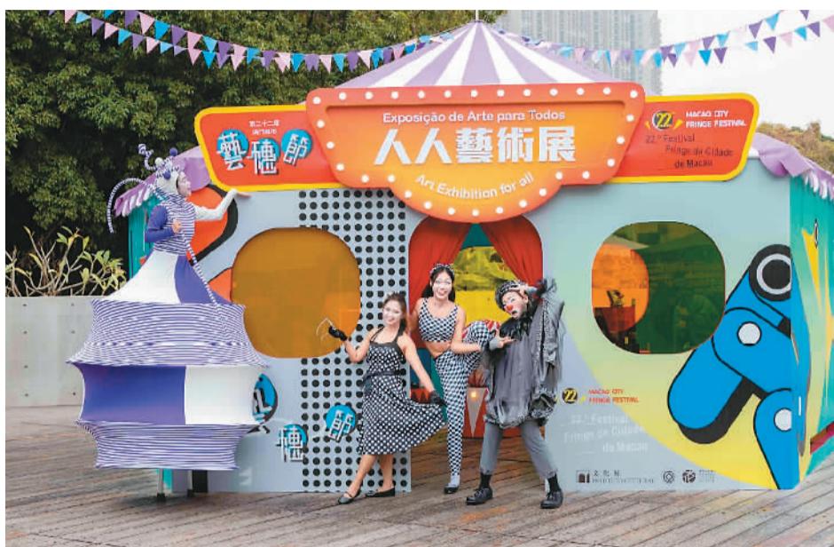
图为澳门艺术节上举办的“人人艺术展”活动现场。

如今，“演艺之都”已成为澳门的一张新名片。国际性流行音乐演唱会、世界古典名家演奏会、实验性舞台演出等各类文艺活动，吸引文艺爱好者齐聚澳门，共同感受濠江小城的多元文化魅力。