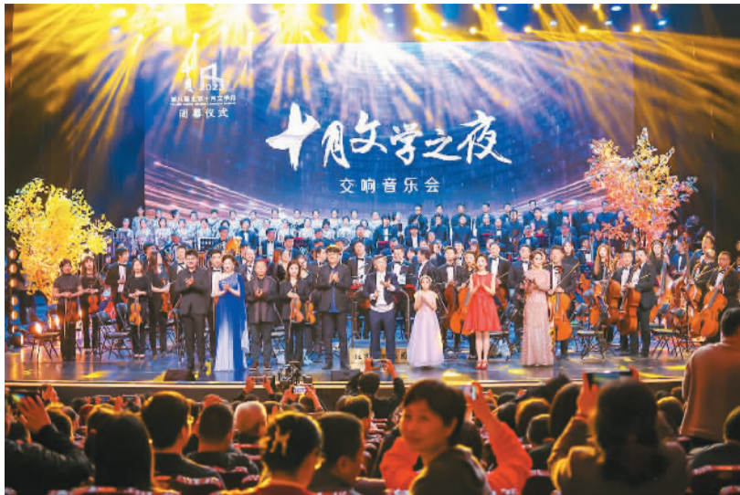
“十月文学之夜”交响音乐会现场。