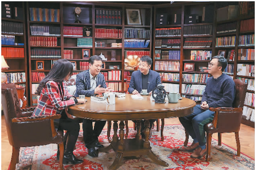
人文谈话类节目《文学馆之夜》录制现场。