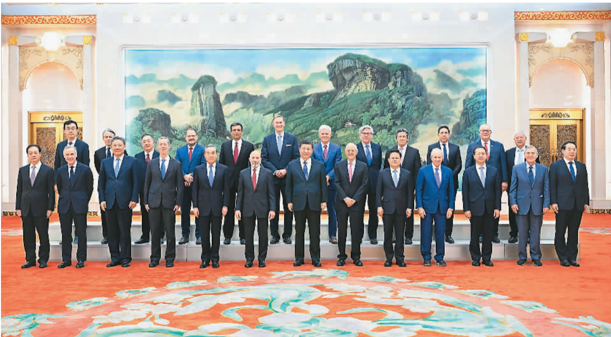
3月27日, 国家主席习近平在北京人民大会堂集体会见美国工商界和战略学术界代表。

■中美关系是世界上最重要的双边关系之一。中美两国是合作还是对抗, 事关两国人民福祉和人类前途命运。中美各自的成功是彼此的机遇。只要双方都把对方视为伙伴, 相互尊重、和平共处、合作共赢, 中美关系就会好起来。今年是中美建交45周年。中美关系史是一部两国人民友好交往的历史, 过去靠人民书写, 未来更要靠人民创造。中国有句话, 从善如登, 从恶如崩。希望两国各界人士多来往、多交流, 不断积累共识, 增进信任, 排除各种干扰, 深化互利合作, 为两国人民带来更多实实在在的福祉, 为世界注入更多稳定性。 ■中国经济是健康、可持续的。去年中国经济增速在世界主要经济体中名列前茅, 对世界经济增长贡献率继续超过30%, 这是中国人民干出来的, 也离不开国际合作。中国的发展历经各种困难挑战才走到今天, 过去没有因为“中国崩溃论”而崩溃, 现在也不会因为“中国见顶论”而见顶。我们将持续推动高质量发展, 持续推进中国式现代化, 既让中国人民不断过上更好生活, 也为世界可持续发展作出更大贡献。中国发展前景是光明的, 我们有这个底气和信心。 ■我多次讲过, 改革开放是当代中国大踏步赶上时代的重要法宝。中国的改革不会停顿, 开放不会止步。我们正在谋划和实施一系列全面深化改革重大举措, 持续建设市场化、法治化、国际化一流营商环境, 为包括美国企业在内的各国企业提供更广阔发展空间。面对中美经贸关系近年来出现的新情况新变化, 双方要坚持相互尊重、互惠互利、平等协商, 按经济规律和市场规则办事, 扩大和深化经贸互利合作, 尊重彼此的发展权利, 追求中美共赢和世界共赢。欢迎美国企业更多参与共建“一带一路”, 参加中国国际进口博览会等大型经贸活动, 继续投资中国、深耕中国、赢在中国。 ■这几年, 中美关系经历了不少波折, 也遭遇过严峻挑战, 其中的教训值得吸取。中美关系回不到过去, 但能够有一个更好的未来。去年我同拜登总统在旧金山会晤, 最大的共识就是中美关系应该稳下来、好起来。过去几个月, 双方团队围绕我和拜登总统达成的共识, 在政治外交、经贸财金、执法禁毒、气候变化、人文交流等各领域保持沟通, 取得了进展。当前形势下, 中美的共同利益不是减少了, 而是更多了。不管是经贸、农业等传统领域, 还是气候变化、人工智能等新兴领域, 中美应该成为对方发展的助力, 而不应该成为阻力。推动世界经济复苏、解决国际和地区热点问题, 都需要中美协调合作, 展现大国胸怀, 拿出大国担当。美方应同中方相向而行, 树立正确战略认知, 妥善处理敏感问题, 保持中美关系止跌企稳的势头, 积极探索正确相处之道, 推动中美关系持续稳定健康向前发展。