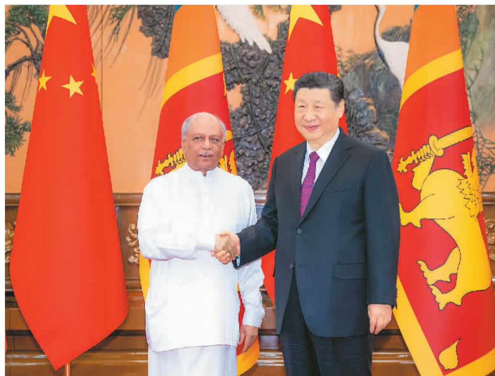
3月27日下午, 国家主席习近平在北京人民大会堂会见来华进行正式访问的斯里兰卡总理古纳瓦德纳。