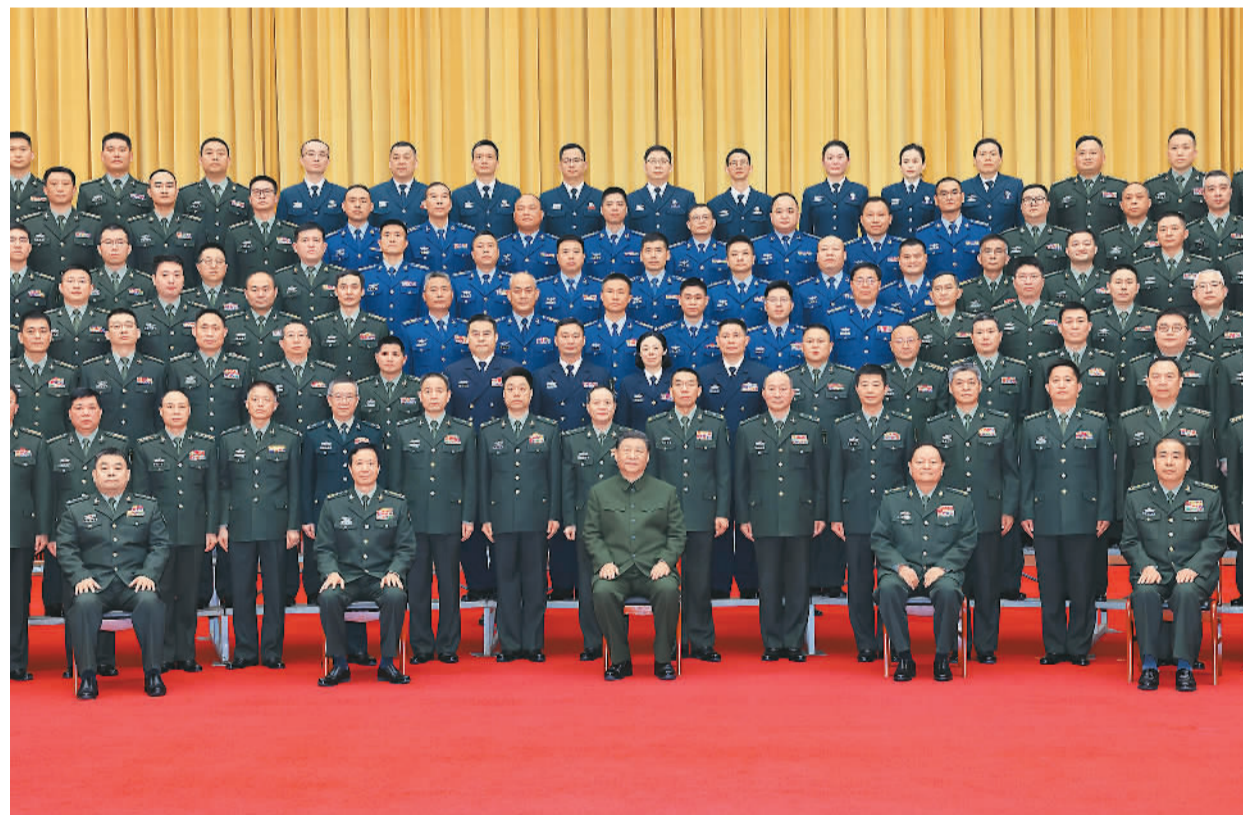
3月18日至21日, 中共中央总书记、国家主席、中央军委主席习近平在湖南考察。这是20日上午, 习近平在长沙亲切接见驻长沙部队以上校级以上领导干部, 代表党中央和中央军委向驻长沙部队全体官兵致以诚挚问候。

湖南是全国13个粮食主产省之一, 水稻播种面积、总产量均居全国第一。当天下午, 习近平来到常德市鼎城区谢家铺镇港中坪村, 走进当地粮食生产万亩综合示范片区, 察看秧苗培育和春耕备耕进展, 听取高质量推进农业现代化情况介绍, 并同种粮大户、农技人员、基层干部一笔一笔算投入产出账。习近平强调, 我国有14