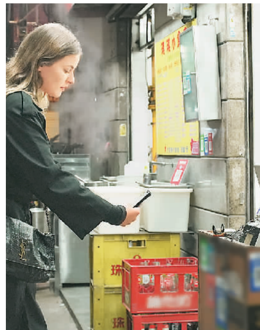
一位来自塞尔维亚的消费者在广东省广州市一家小食店使用微信扫码支付。

现在，浦江县“新农人”队伍已扩大到227人，在他们的主导推动下，全县逐步形成特色种养、休闲旅游、文化创意等15类特色强村富民产业，带动该县村级集体经济经营性年收入首次突破2亿元。